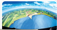
みえつドームシアター 直径6mのドーム型スクリーンで佐賀藩の挑戦を体感!

その中で、洋式海軍を創立し洋式艦船の整備を進め、独自に海軍訓練を行うようになり、三重津に海軍施設を整えていきます。1861(文久元年)年までには、洋式船の修理に使用する部品をつくる「製作場」や修理などのために船を引き入れる「修覆場」などを整備。三重津海軍所は、幕末の佐賀藩の洋式船による海軍教育、船の操縦や射撃等の訓練、船の修理や船をつくる施設として機能しました。三重津海軍所跡のドックは、洋式船の修理用ドックとしては現存する国内最古のもので、日本初の実用蒸気船となる「凌風丸」は、1865(慶応元年)年に、ここ三重津海軍所でつくられました。