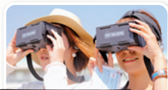
みえつSCOPE (VR機器) SCOPEをのぞくと、当時の様子が広がります