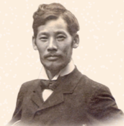
岡田 三郎助(明治39年撮影)