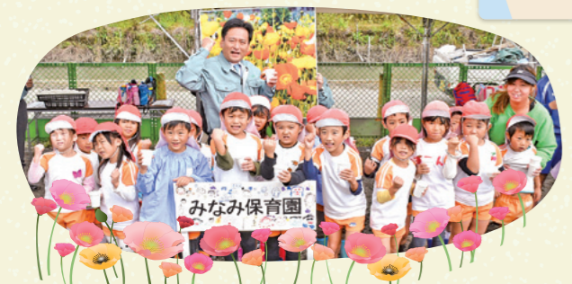
参加園：博愛の里こども園・鳳鳴乃里幼稚園・小鹿幼稚園・みなみ保育園