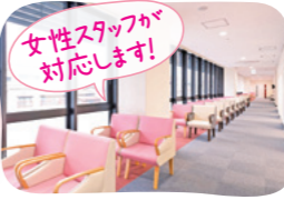
女性専用の待合室

県立病院好生館跡地にオープンした佐賀メディカルセンタービル2階「佐賀県健診・検査センター」には、女性専用の健診エリアを設置しています。