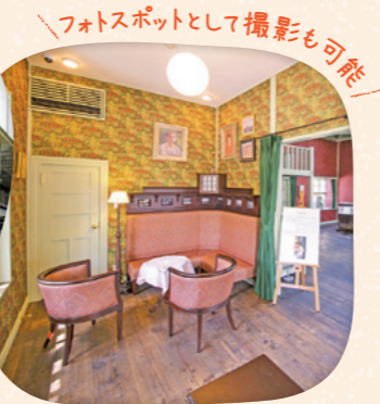
「フオスポットとして撮影も可能」