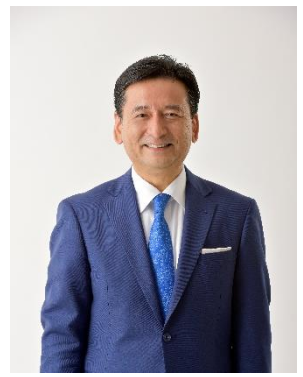
よしのり 佐賀県知事 山口祥義

佐賀県では今後も、関係団体や市町と連携しながら、消費者トラブルの防止と発生時に十分な救済を図れる相談体制を確保し、県民の皆さまが安全安心に暮らせるよう努めてまいります。