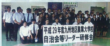
九州各県農大の自治会リーダー達

九州沖縄各県の農業大学校自治会等のリーダーら45名が集まり、学生自治会活動の活性化等についての意見・情報交換や当地の農家レストラン「なな菜」での現地研修も行いました。