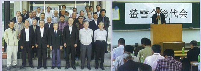
農大職員と螢雪会各支部総代の皆さん