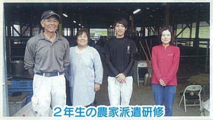
2年生の農家派遣研修 たいへん勉強になりました