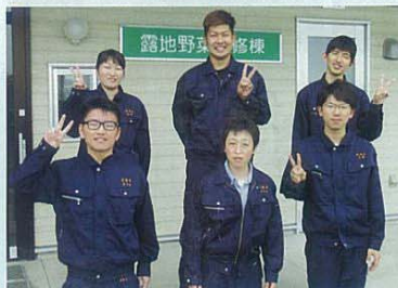
野菜複合(農産・露地野菜:野菜)