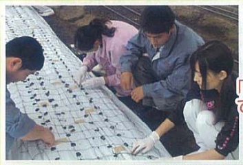
「未来さが農業塾」 で高校生が農大生 と実習