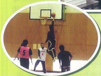
校内スポーツ大会