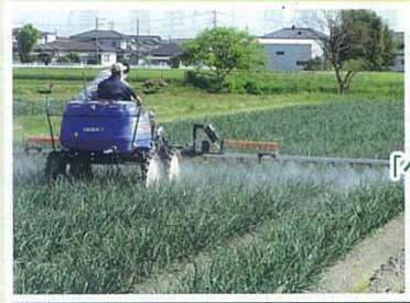
タマネギ防除 「べと病」対策です