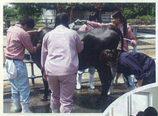
第1回 オープンキャンパス 高校生達の実習体験