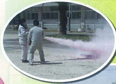
避難訓練 真剣です!