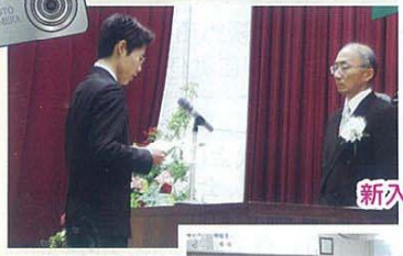
入学式 新入生代表の宣誓