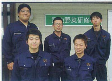
野菜複合(農産・露地野菜:農産)