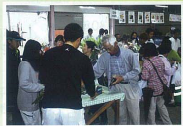
毎週水曜日午後2時からの直売