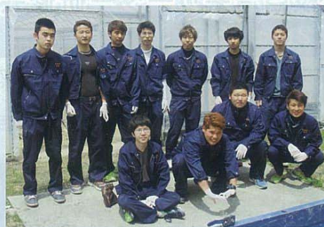
野菜複合(施設野菜)