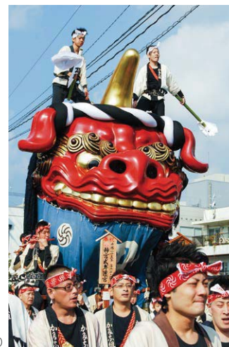
刀町の赤獅子

唐津神社の秋祭り。1819(文政2)年に作られた刀町の赤獅子から1876(明治9)年に作られた江川町の七宝丸までの合計14台の豪華な曳山が、各町の曳子達に曳かれ町を巡ります。