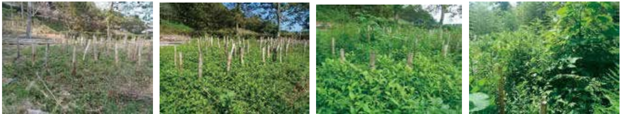
【27-②】 杵島郡白石町辺田 〈竹無〉