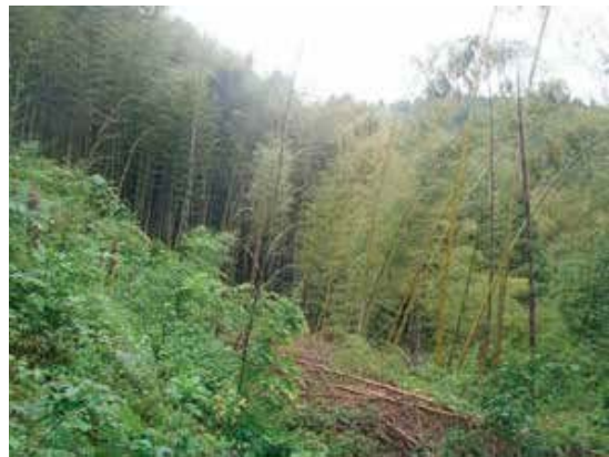
周辺竹林から伐採跡地への竹の侵入