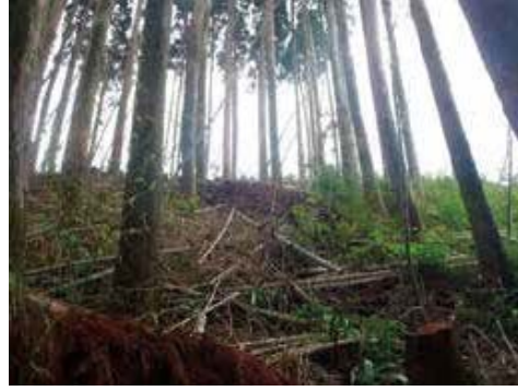
薬剤散布地外での新竹発生