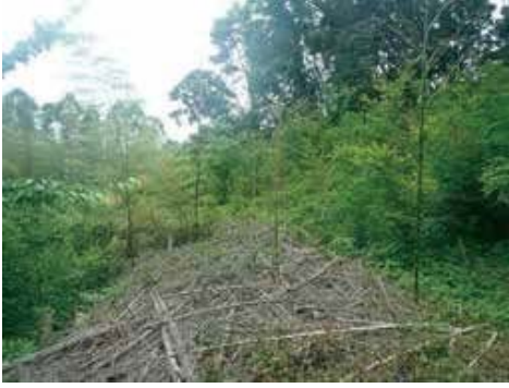
下刈り困難な伐採竹集積地から新竹発生