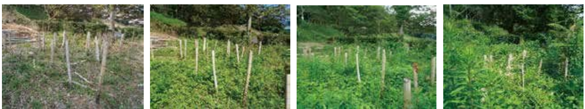
【27-④】 杵島郡白石町辺田 〈竹無〉