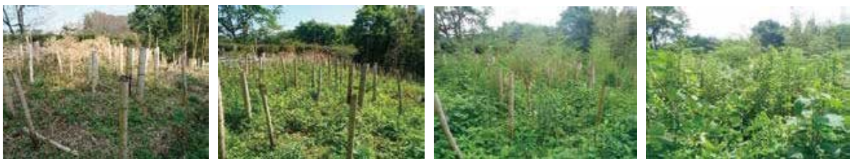
【27-③】 杵島郡白石町辺田 〈竹無〉