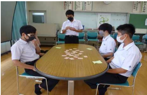
予選会は 5色百人一首の札で行いました。

百人一首大会を、開催する前に ろうか掲示で、百人一首の紹介 参加は、2人1組で、予選会を 行い、決勝戦は、3組で競って 盛り上がりました。