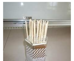
事典クイズ用くじびき

今年度購入したポプラディアを、 活用してもらい、事典に興味を持 ってもらえるようになった。