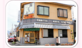
嬉野温泉湯どうぶ 宗庵よこ長

カード決済を導入して、お客様から便利になったと好評です。海外からの観光客のカード利用者も多いので会計も楽になりました。