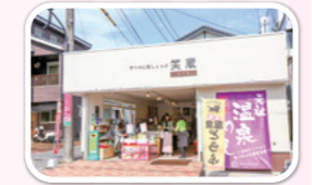
すーべにあしよっぶ 笑蔵