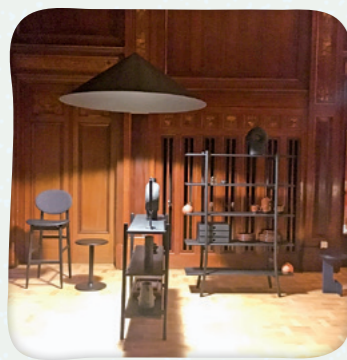
スウェーデンでの国際家具見本市

2月にはスウェーデンで開催された世界的にも大規模な「ストックホルム国際家具見本市」に出展。ヨーロッパのインテリアデザイナーやバイヤーなど多くの来場者がブースを訪れ、北欧での認知度も高まりました。今後、ブランド価値をさらに高めアジア市場にも展開していきたいとのこと。今、世界から佐賀の家具が注目を集めています。