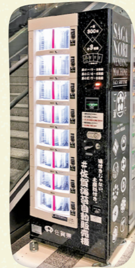
正面玄関入ってすぐ!