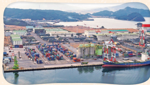
伊万里から世界へ! コンテナが並ぶ伊万里港

県内で唯一、コンテナ貨物の輸出入を取り扱っている伊万里港は、2018年の取扱量が3万7,346個となり、3年連続で過去最多を更新しました。アジアに近い立地を生かして韓国や中国の主要港と5航路週7便が就航しており、近年では、神戸や釜山などのハブ港を経由し、東南アジアへの輸出が増えているのも、取扱量が増加した理由の一つ。世界に開かれた物流拠点として、今後も輸出入コンテナの増加や航路の増便を目指しています。