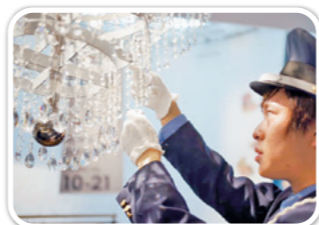
東京・表参道での展示会に向けてジャンディアの作品を展示する様子

県主催イベント「弘道館2」のスペシャルゲストとして出演。自身の想いを熱く語っていただきました。