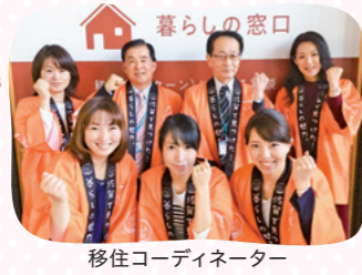
移住コーディネーター