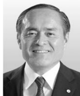
吉田 ただとも 社民党前党首、元参議院議員、 大分県ウエイトリフティング協会会長 【私のこだわり】 雇用労働、農林水産振興 子育て・教育、地方自治、交通