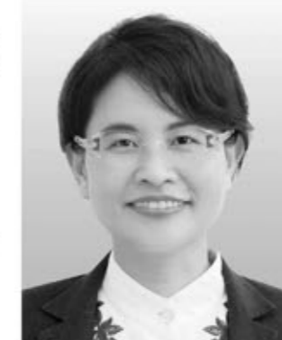
仲村 みお 前沖縄県議、沖縄平和運動センター副議長 自治体議員立憲ネットワーク共同代表 【私のこだわり】 地方自治、沖縄振興、子どもの貧困 子育て・教育、医療・福祉、基地問題