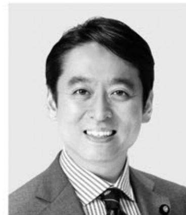
平木 だいさく 現 役職:元経済産業大臣政務官。 参院議員1期。 経歴:東京大学法学部卒。 年齢:44歳 未来をひらく 確かな実力!