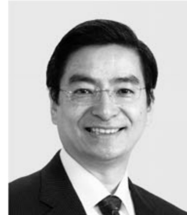
山本 ひろし 現 役職:元財務大臣政務官。 参院議員2期。 経歴:慶應義塾大学法学部卒。 年齢:64歳 現場直結で障がい者支援と地域復興