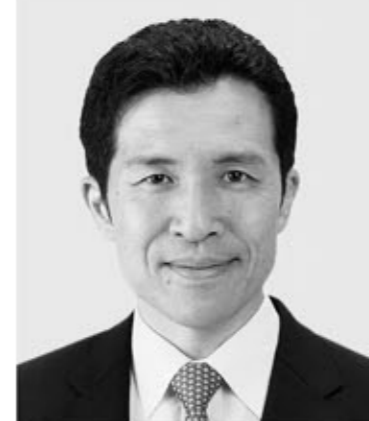
新妻 ひでき 現 役職:元文部科学大臣政務官。 参院議員1期。 経歴:東京大学大学院修士課程修了。 年齢:48歳 「ものづくり」でこの国を元気に!