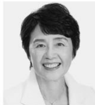
党農林・漁民局長 紙 智子 現 64歳。参院議員3期。