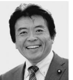
弁護士 仁比 そうへい 現 55歳。参院議員2期。党参院国対副委員長。