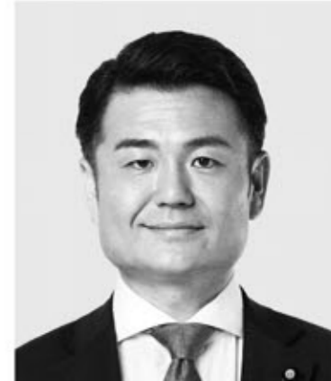
かわの 義博 現 役職:党食品ロス削減推進 プロジェクトチーム事務局長。 参院議員1期。 経歴:慶應義塾大学経済学部卒。 年齢:41歳 近い。速い。温かい。

公明党は、参院選比例区に上記の6人をはじめ17人を公認しています。(順不同) ※年齢は公示日現在