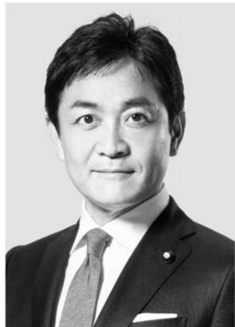
国民民主党 代表 玉木雄一郎