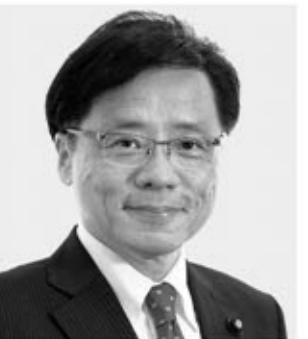
党参院幹事長・国対委員長 井上 さとし 現 61歳。参院議員3期。