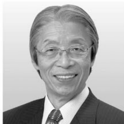
[党首] 又市 征治