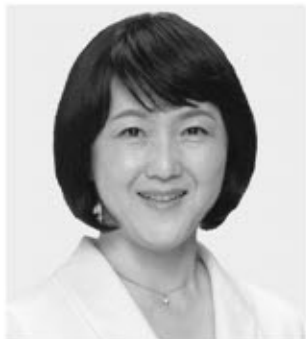
前衆議院議員 梅村 さえこ 新 55歳。元消費税をなくす全国の会事務局長。