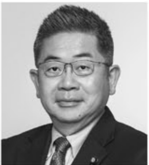
党書記局長 小池 晃 現 59歳。参院議員3期。全国革新懇代表世話人。医師。