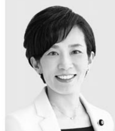
山本 かなえ 現 役職:元厚生労働副大臣。 参院議員3期。 経歴:京都大学文学部卒。 年齢:48歳 「あなたの声を、かなえるチカラ。」