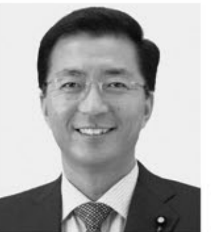
党副委員長 山下 よしき 現 59歳。参院議員3期。