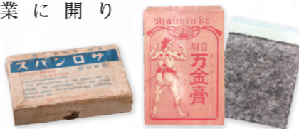
当時の貼薬「朝日万金膏」の色、匂いが改良され「サロンパス®」が生まれました。