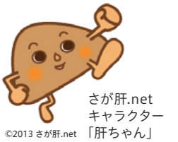
さが肝.net キャラクター 「肝ちゃん」