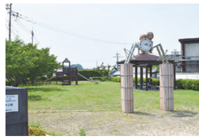
場所 伊万里市大坪町

太一郎は1922年、私財で故郷・伊万里の酪農を支援し、練乳工場も建設。その工場跡地が公園として整備された。森永製菓のシンボル「エンゼル」が、故郷を見守る。