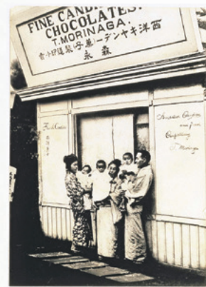
1900年4月に東京の赤坂に構えた店の前で家族と。英字の看板は当時はめずらしかった。

1899年に帰国し、すぐに東京のわずか2坪の工場で「森永西洋菓子製造所」を始めました。当時は、西洋菓子が珍しい時代であり、実物見本を入れたガラス張りの箱車を引いて販売しますが、な