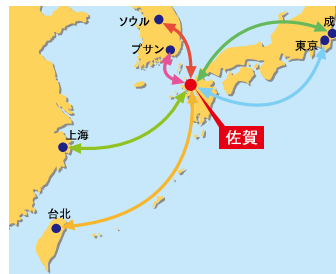
路線図(令和元年6月現在)