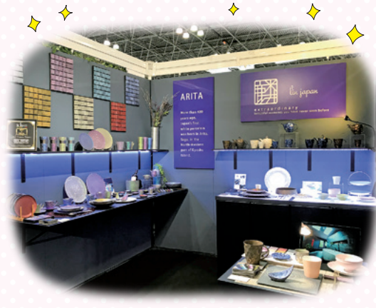
受賞したブースデザイン