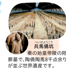
へいほうこう 兵馬俑坑 秦の始皇帝陵の陪葬墓で、陶俑陶馬8千点余りが並び世界遺産です。