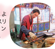
ガンタン(チベット) 灌湯包子