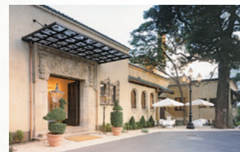
旧小笠原伯爵邸。現在はレストランとして使用されている。(東京都新宿区)

旧館(国重要文化財)、旧小笠原伯爵邸(東京都選定歴史的建造物)などが現存し、今なお注目されています。(協力・佐賀新聞社)