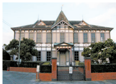
場所 唐津市海岸通(現在は休館中)

1908年に石炭積出で栄えていた唐津西港に建てられた総2階建ての木造洋風建築。建設当時は「三菱御殿」と呼ばれ、三菱の建築顧問だった曾禰が、この建物の設計に関与したとされる。県重要文化財。