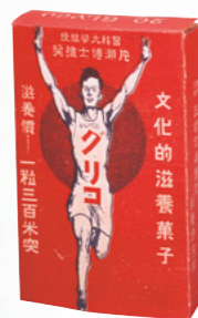
初期のグリコパッケージ

1919年のある日、有明海近くの早津江川の河原で、利一は牡蠣の加工小屋で捨てられていた煮汁を見て、「牡蠣にはエネルギーの代謝に必要なグリコーゲンが含まれる」という記事を思い出します。分析の結果、牡蠣の煮汁に豊富なグリコーゲンが含まれているとわかる