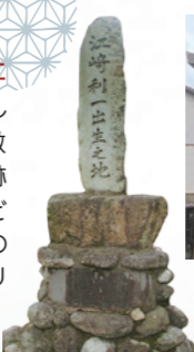
場所 佐賀市蓮池町

「江崎利一出生之地」の石碑と八坂神社 利一が寄贈した生家は、再建後も利一が揮ごうした額が掲げられ、公民館として利用されている。敷地内には「江崎利一出生之地」と記した石碑や足跡を紹介する案内板がある。近くの八坂神社は子どもたちがかけっこする姿から利一が「グリコ」のゴールインマークを思いついた場所として、「グリコポーズ発祥の地」とされる。