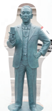
場所 佐賀市白山1丁目