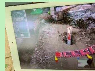
【スクリーンショットで現場状況を記録】