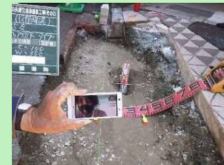
【使い慣れた機器を使用】