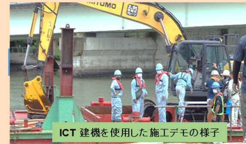
ICT建機を使用した施工デモの様子