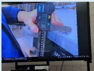
【寸法の数値化（デジタルノギス）】