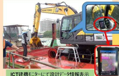
ICT建機モニターにて設計データ情報表示