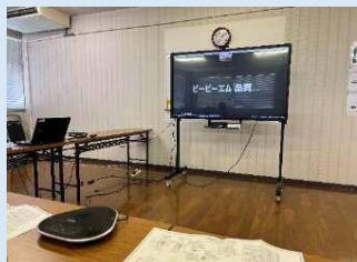
【大型モニター・マイクロソフトの利用】