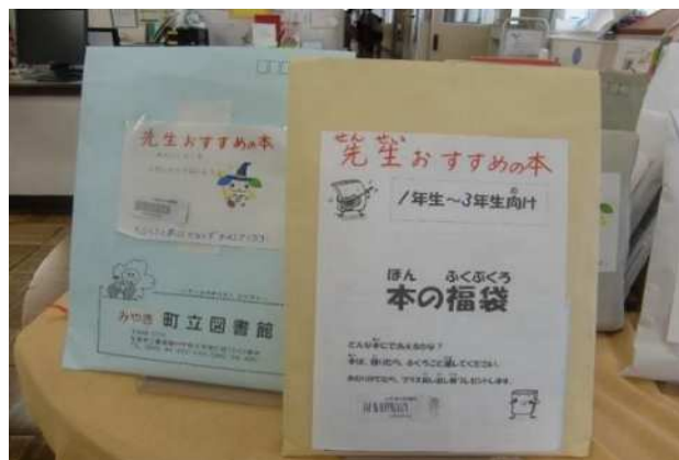
本の福袋（今年度1番の人気イベント）