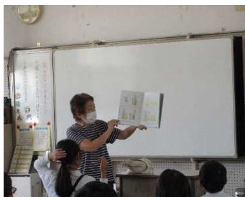
(朝の読み聞かせの様子)

今年度は、1学期4回 2学期7回 3学期4回の計15回実施予定です。金曜日の始業前10分程度の読み聞かせを、全部の学年に行ってもらっています。メンバーが、足りないときは、司書も応援メンバーになります。三根西小は、小規模校ですが、ボランティアのメンバーは10名ほど在籍されており、全学年に読み聞かせを実施することができています。読み聞かせノートは、毎回先生方に回覧しています。読まれる本は、学校図書館からも借りてもらい、紹介してもらっています。