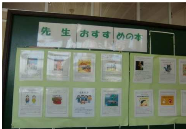
おすすめの本紹介（廊下掲示）

先生方におすすめの本を紹介してもらい、廊下掲示と、図書館にコーナーを作って貸し出しました。2学期は、1年生から3年生用と、4年生から6年生用に1冊ずつ紹介してもらい、1～3年生用と4～6年生用に1冊ずつ本の福袋にして貸し出しました。（くじ券を入れて、当たりが出たら、プラス貸し出し券をプレゼントしました。）