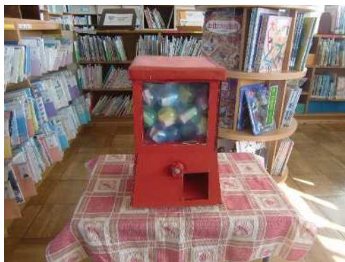
くじ引き用のガチャガチャは、6年前職員が作成

年2回開催しています。1学期は、分類ビンゴと、図書委員による1・2年生への読み聞かせ、2学期は、オリジナルしおりコンクールとスタンプカード、図書館クイズを行いました。ビンゴ、スタンプカードを達成した児童は、ガチャガチャができます。景品には、1日図書委員体験券や、本の付録や本のカバーのエコバックなどを用意して、子供たちに好評でした。