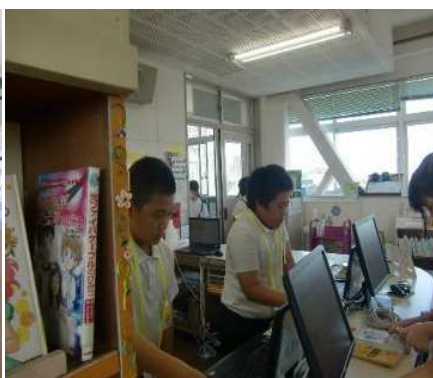
図書委員体験券で、体験中の4年生。体験券は、3年生以上に限定しました。