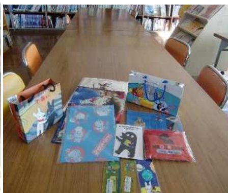
くじの景品は、本エコバックや、本の付録・1日図書委員体験券など用意しました。