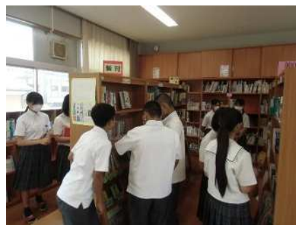
後期の図書館では引っ越しの準備が着々と進んでいます。