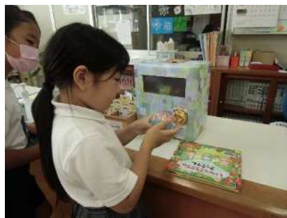
制作した手作りガチャは、貸出冊数の達成の意識向上にも繋がりました。