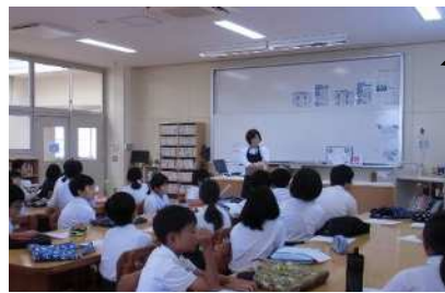
5年生へのオリエンテーションの様子