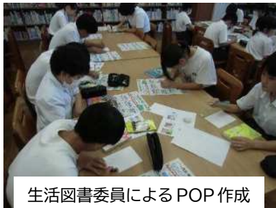
生活図書委員によるPOP作成