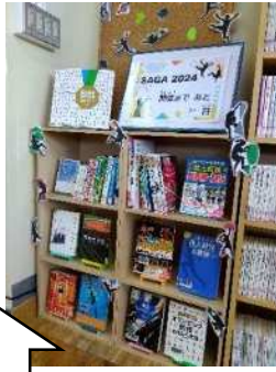
SAGA2024 国スポ・全障スポ特集コーナーは多久市実行委員会のインスタでも紹介していただきました。