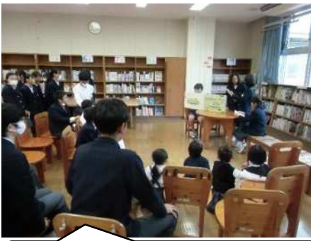
『そらまめくんのベッド』を読みました。

昼休みの時間を利用して委員会の後期生徒によるしおり作り体験や、5・6・7年生による大型絵本の読み聞かせが行われました。後期過程の生徒も久々の読み聞かせを楽しみに参加していました。