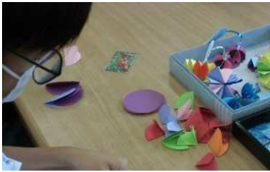
丸く切った画用紙で傘を作りました ☂