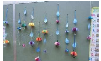
完成! 風に揺られてキラキラ綺麗 ✨