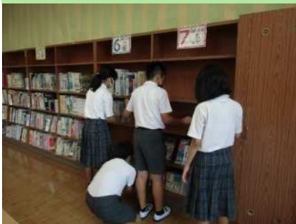
前期の図書館では本棚と本の配置換えをしました。低学年の児童も本が探しやすくなりました。