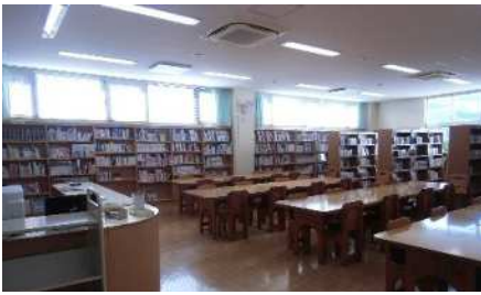
いよいよ新図書館が開館！新しい本棚からは、木の温もりが感じられます。