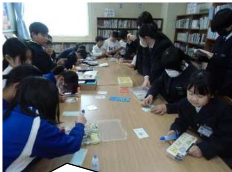
オリジナルのしおりだと読書が楽しくなるね♪