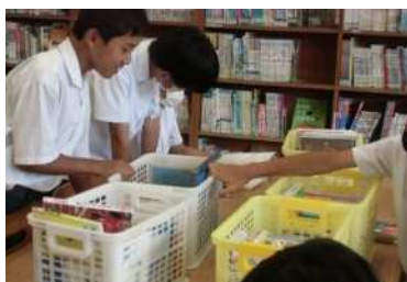
毎週水・金曜日は前期の図書館で後期の本を貸出する『出張図書館』を開催。