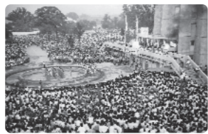
聖火歓迎式典 (市村記念体育館前)

昭和39年の東京オリンピック開催に向けて行われた準備や、県内を駆け抜けた聖火リレーについて、当時の公文書から紹介します。