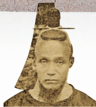
(函館市中央図書館所蔵)

初代開拓使長官に就くと、島は開拓判官に就任。直正は病身のため間もなく長官を辞任しますが、島は北海道に赴任し、本府の地を原野が広がっていた札幌に決めます。北側は官庁街、南側を商業地区とし、幅約20メートルの道路で区画。碁盤の目のような整然とした街並みを目指した壮大な構想で、京都や佐賀城下を念頭に描いたと考えられ、「いつの日か、世界一の都になるであろう」と島は漢詩に詠み込みました。同年11月半ばに札幌