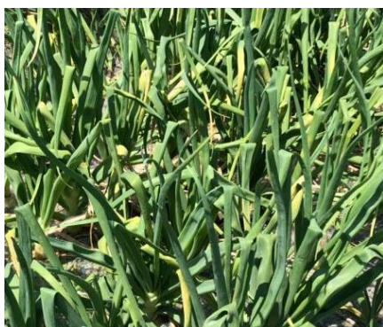
写真1 マルチ栽培圃場での発病