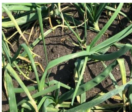
写真2 露地栽培圃場での発病