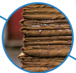
醤油・味噌 丸秀醤油株式会社