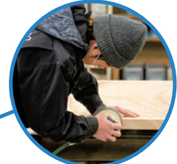
諸富家具 レグナテック株式会社