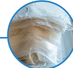
和紙 名尾手すき和紙株式会社