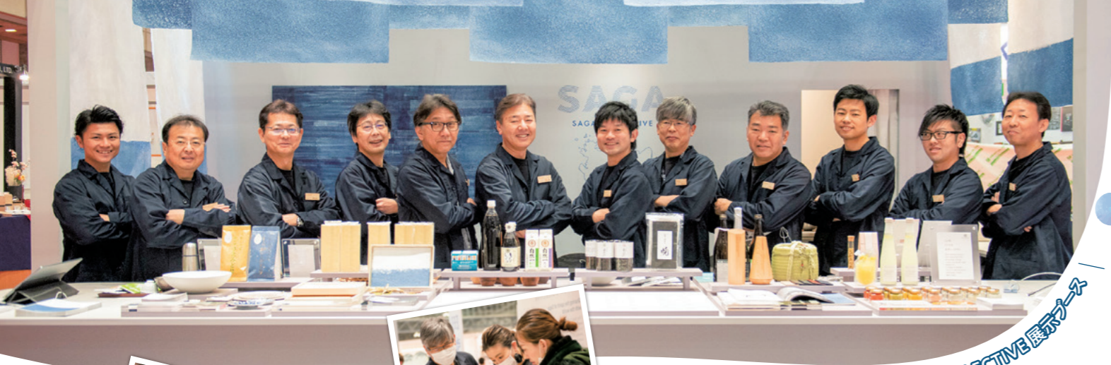
国際ホテル・レストラン・ショー SAGA COLLECTIVE 展示ブース