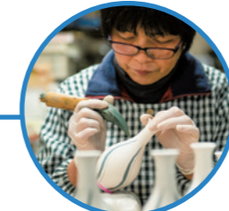
有田焼 有限会社李荘窯業所