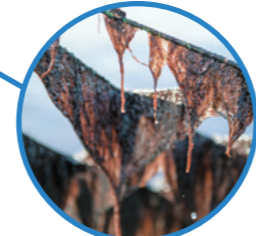
佐賀海苔 三福海苔株式会社