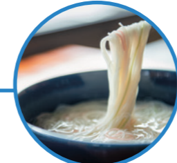
神埼そうめん 有限会社井上製麺