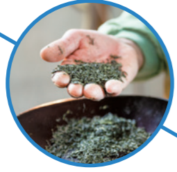
うれしの茶 株式会社小野原製茶問屋