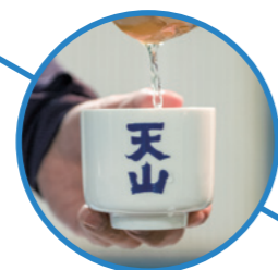
日本酒 天山酒造株式会社