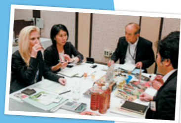
海外のバイヤーとの 商談も支援!