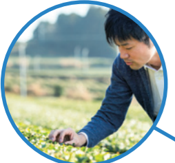
うれしの茶 株式会社徳永製茶

「ブースには海外のメディアも多数訪れ、匠の技が活かした繊細で高品質な佐賀の良品への関心の高さを感じました。今回、内装から家具、食器、食材全体で佐賀を提案することでさらに強く印象づけることができ、大きな手応えを感じています。それぞれの生産者が築いてきた点と点が繋がって線や面として佐賀の魅力を発信し、最終的には世界から佐賀に来ていただき、ものづくりの現場を体験