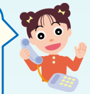
だまされないちゃん