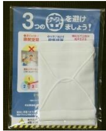
全戸配布予定の布マスク