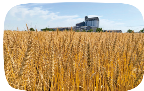
進んだ基盤整備と温暖な気候を活かして 麦が広く作付けされています

全国でも有数の麦の産地である佐賀県では、ビール用大麦や麵用小麦よりも収益性が高い、2種類のパン用小麦の栽培が広がっています。「はる風ふわり」で焼き上げた食パンは、ふわふわもちもちの食感。「さちかおり」はフランスパン専用で、外はカリッと、噛むともっちりとした食感。いずれもパン屋さんからの評判は上々です。佐賀で育った小麦が、全国各地のパン屋さんで使われるようになって、食べた人のおいしい笑顔が増える嬉しそうですね。