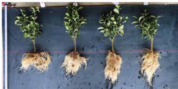
写真 慣行定植法(左)、ドリルオーガ植穴定植法(右)