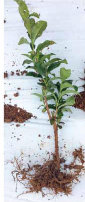
写真：嬉野町内の幼木茶園における根圏発達状況（いずれもマルチ栽培園）