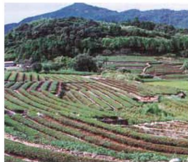
写真：1994年8月 嬉野町内における干ばつ被害状況（下吉田地区、井出川内地区）