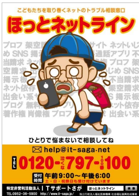
ほっとネットライン ポスター