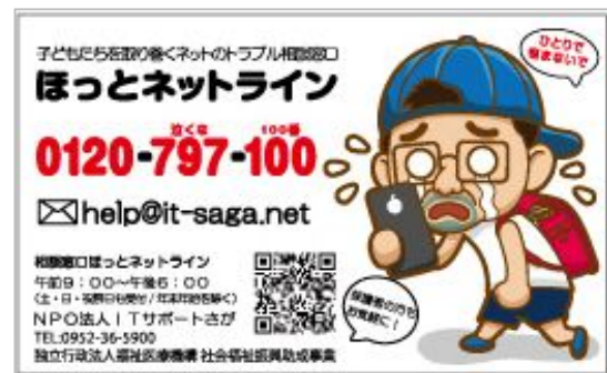
ほっとネットライン カード