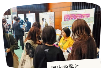
県内企業と大学生との交流会

大学生や既就職者の就職（転職）については、就職支援サイト「さが就活ナビ」や「さがUターンナビ」による情報発信、就職支援施設「ジヨブカフェSAGA」によるキャリア相談などのほか、県内企業との交流会やWEB企業説明会の開催、WEB面接の支援、県外進学者や在住者の県内就職活動のための交通費助成などを行っています。