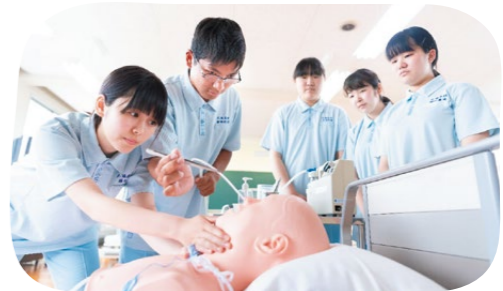
生徒の実習の様子(介護関係)

県内の私立高等学校に通う生徒のうち、卒業後に就職を考えている生徒の多くは、県内での就職を希望しています。しかし、近年、就職希望者の県内就職率は低下する傾向にあり、新たな県内求人獲得が課題となっています。