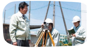
生徒の実習の様子(土木関係)

このため、県では、県内企業からの新規求人を増やし、生徒の県内就職につなげることを目指し、資格取得や技術習得に必要な設備の整備や外部講師の招へいを支援しています。