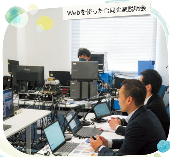
Webを使った合同企業説明会

佐賀県は、素晴らしい技術や特徴を持つ企業が多数あり、また、豊かな食や、人ととの深いつながりがあるなど、生活しやすく、魅力にあふれた地域です。一方で、佐賀で学ぶ高校生は、卒業後、就職者の約4割、進学者の約8割が県外を選んでいきます。