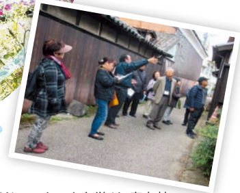
観光ガイドのノウハウを学ぶ:鹿島校

卒業生の活動は、福祉施設への慰問、街の緑化活動、観光ガイドなど多岐にわたっており、約7割の卒業生が、何らかの地域活動をされています。 今年度から新たに鳥栖校を開校しました。より多くの方々が学び、交流し、地域の担い手として活躍されるよう、高齢者の社会参加を推進していきます。