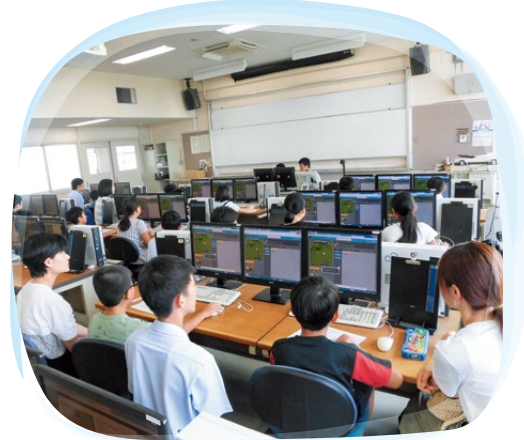
小・中学生プログラミング教室(白石高校)

県立高校8校では、「地域とつながる高校魅力づくりプロジェクト」に取り組んでいます。