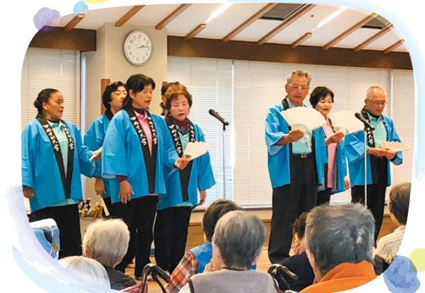
高齢者福祉施設訪問:佐賀校