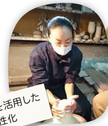
有田焼を活用した地域活性化

地域おこし協力隊とは、地方自治体が、地域外から人材を積極的に受け入れ、その人たちに「地域おこし協力隊員」となってもらい、農業・漁業への従事や地場産品の開発・販売、地域の魅力PRなど、様々な活動を行ってもらいながら、その地域への定住と定着を図る取組です。