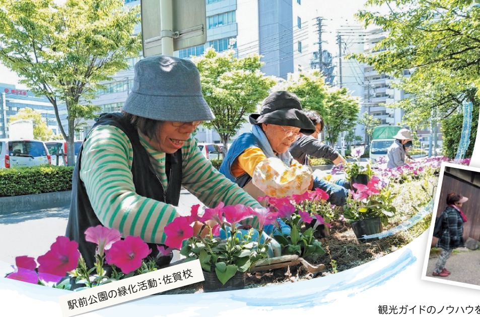
駅前公園の緑化活動:佐賀校