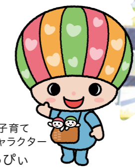
佐賀県子育て 応援キャラクター さがっぴい

男女ともに、がん治療の影響で、妊よう性(妊娠するための力)が低下又は失われる場合があるため、がん治療の前に精子や卵子等採取し凍結保存する「妊よう性温存治療」を行う方法があります。この治療には、公的医療保険の適用がなく、経済的に大きな負担となっています。 このため、県では、40歳未満の若年がん患者を対象に、妊よう性温存治療費の一部を助成することで、経済的負担を軽減し、将来的に子どもを産み育てることができるという希望を持ってがん治療ができる環境を整備しています。 3 「子育てし大券」2020 で吉野ヶ里へGO! 「子育てし大券」が「プロジェクトの一環として平成29(2017)年度から毎年、吉野ヶ里歴史公園の入園料が無料となる招待券「子育てし大券」を配布しています。 県内だけでなく、県外の子育て世代の方にもご利用いただき、来園者数は年々増えています。園内には子どもたちに人気の巨大なふわふわドームなど、楽しい遊具で遊んだり、バーベキューができるエリアもあります。ぜひ、この機会に吉野ヶ里歴史公園へお越しください。