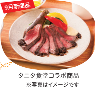
タニタ食堂コラボ商品 ※写真はイメージです

新型コロナウイルス感染症の影響で厳しい状況にある生産者や事業者を応援する「佐賀支援愛」応援キャンペーンの一環として、特設サイト「佐賀10000円ショップ」がオープン!その名の通り商品は全て1万円均一。佐賀牛®など高級農畜産物のほか、佐賀にゆかりのあるクリエイターや企業とのコラボ商品も販売中です。サイトでは、生産者の熱い想いや、魅力的なストーリーのある商品ばかりを紹介しています。ぜひみんなで買ったたり、食べたたり、いろんな形で支え合ひましょう。