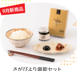
さがびより堪能セット