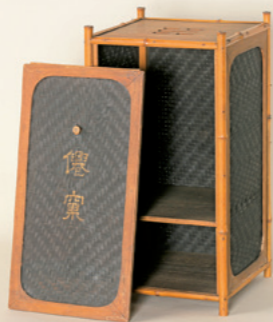
売茶翁が焼却した愛用の茶道具。炉を収める移 動用の籠で、江戸時代後期頃に模造されたもの として、会期中展示されます。

売茶翁は、漢文に堪能で、漢詩や 和歌、書家としても超一級。京都で は「売茶翁に一服接待されなければ