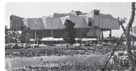
開館当時の県立博物館

佐賀の公共施設の設計には、戦後日本の建築史に名を残す多くの建築家たちが携わっています。今回は、図面や建設時の文書、写真、模型等を展示し、彼らが設計に込めた地方発展への想いを紹介します。