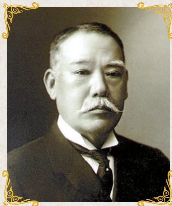
高取 伊好 (1850~1927年)

明治から大正期に炭鉱を開発、経営し、「肥前の炭鉱王」とも呼ばれた高取伊好。漢詩や書にも堪能な文化人で、文化教育や産業振興に寄附を続けるなど社会貢献でも評価されています。