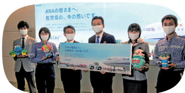
羽田空港に応援メッセージを掲出しています