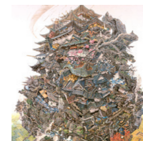
《興亡史》2006 紙にペン、インク 200×200cm 高橋龍太郎コレクション