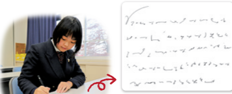
(約130文字分) 約3200文字分の言葉を瞬時に符号で書き取ります