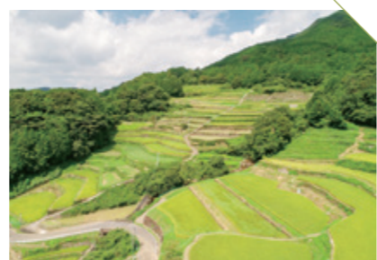
かわち 川内の棚田 [武雄市若木町] CHECK/ジラカンスの桜