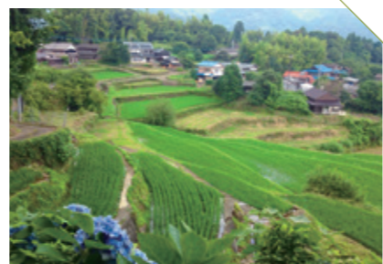
ひらの 平野の棚田 [多久市西多久町] CHECK/10月の稲刈りイベント