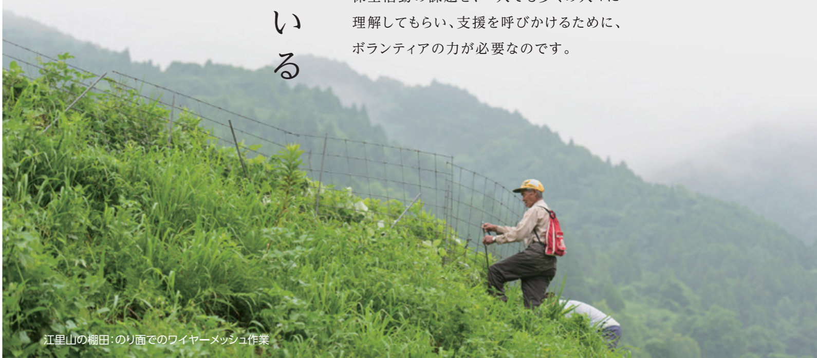
江里山の棚田：のり面でのワイヤーメッシュ作業