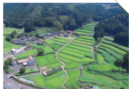
あまがわ 天川の棚田 [唐津市厳木町] CHECK/特別栽培米「コシヒカリ」