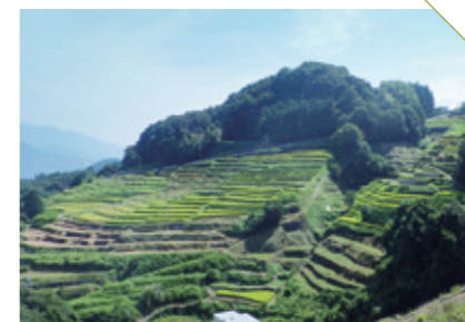
あまがせ 天ヶ瀬の棚田 [多久市南多久町] CHECK/鬼の鼻山の中腹に位置する