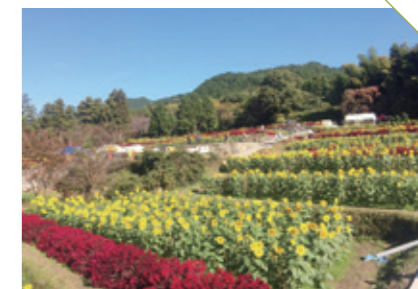
やまだ 山田の棚田 [三養基郡みやき町] CHECK/11月のひまわり園は大人気