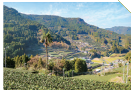
かみいわや 上岩屋の棚田 [嬉野市嬉野町] CHECK/段々に茶畑が広がるエリア