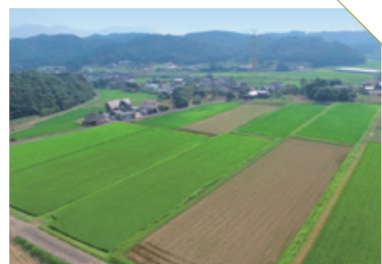
はらあけ 原明の棚田 [西松浦郡有田町] CHECK/自然農法の米やきな粉