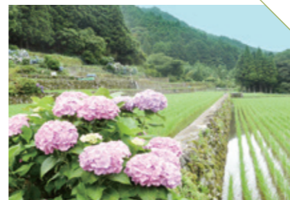
なかこぼ 中木庭地区の棚田 [鹿島市中木庭] CHECK/紫陽花の季節は撮影おススメ