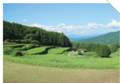
すみやま 炭山の棚田 [伊万里市二里町] CHECK/初夏は紫陽花、秋は彼岸花