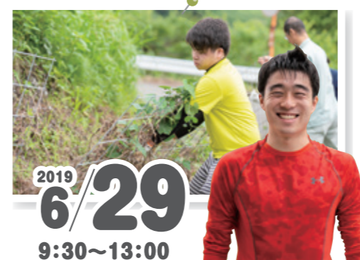
ワイヤーメッシュの点検・整備ボランティア日記 久留米ゼミナール佐賀校 学生5名

江里山の棚田は、棚田に張り巡らされた害獣から棚田を守るワイヤーメッシュの点検や整備のために、棚田ボランティアを募集していました。そこで、協定先となった久留米ゼミナール佐賀校の学生が、ワイヤーメッシュに関する作業支援を行いました。