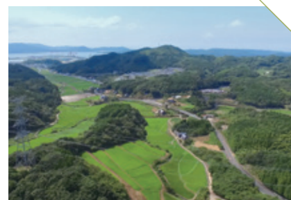
きんご 金吾の棚田 [伊万里市黒川町] CHECK/農作業の担い手募集中!