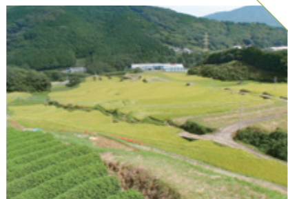
とろくの 兎鹿野の棚田 [嬉野市嬉野町] CHECK/標高200mほどのところにある