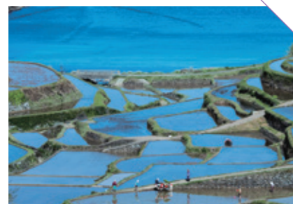
はまのうら 浜野浦の棚田 [東松浦郡玄海町] CHECK/夕日に映える棚田の景色

日本の棚田百選 全国117市町村、134地区の 棚田を認定し佐賀県からは 6地区が認定されています。