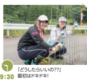
「どうしたらいいの?」最初はドキドキ!

ワイヤーメッシュに絡みついた雑草を取り除いてきれいにするとところからスタート。 草がなかなかしぶといなー。このメッシュがないと田んぼにイノシシが入ってきて、獣臭い田んぼとなり米がダメになるんだって。棚田には必要なメッシュ、しっかりと作業するぞ。