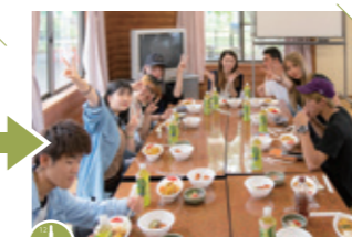
12:00 お替り自由。手作りカレーに大満足。