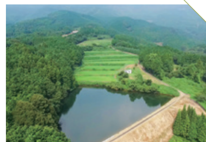
たちべ 立部の棚田 [西松浦郡有田町] CHECK/11月 立部歩こう会開催