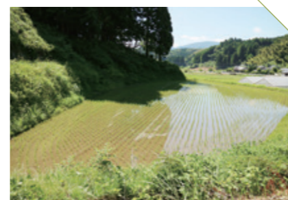
なかのつる 中鶴の棚田 [佐賀市三瀬村] CHECK/中鶴公民館そばで川遊び