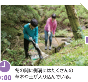
冬の間側溝にはたくさんの草や土が入り込んでいる。

側溝の草払いは二方向からスタート。合流するまで前へ進めー! 農道脇の側溝には草や土が入り込んでとても水が流れる状態じゃないじゃないか! 落石もあって大変だ。大きな石はみんなで動かそう。 田植え前のひと仕事は大切な作業なんだね。