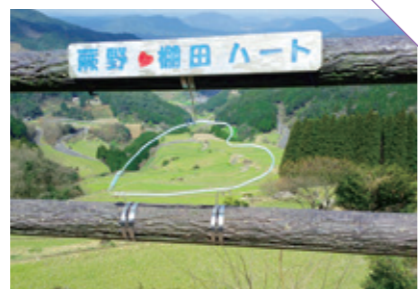
わらびの 蕨野の棚田 [唐津市相知町] CHECK/ハートの形が見える田んぼ