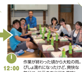
作業が終わった頃から大粒の雨。びしょ濡れになったけど、爽やかな気分。地元のお弁当も美味し〜♪

ワイヤーメッシュの草を取って、またメッシュを立て直す作業を、集落の皆さんと一緒に行いました。自分たちは少しの時間だけの手伝いですが、実際に棚田を守る農家さんにとっては毎日のことで、大変だと実感しました。少しでもお役に立て喜んでもらえたら嬉しいです。