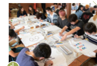
11:00 楽しいけど、棚田の中に展示されるからしっかりと描かなきゃ。

棚田館で白いTシャツに自由に絵を描いて、 アート展に展示するためのTシャツを仕上げましょう。 布地用の絵の具を使って、さあ、スタート。