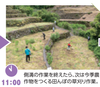
側溝の作業を終えたら、次は今季農作物をつくる田んぼの草刈り作業。