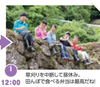
草刈りを中断して昼休み。田んぼで食べる弁当は最高だね!

スコップ片手に何度も何度も土をかき出して、ようやく水が通る溝になった。棚田での農作業は慣れているけど、側溝の清掃はけっこう重労働。水源まで行ってみると、水の流れを確保することの大切さが身に染みて分かりました。