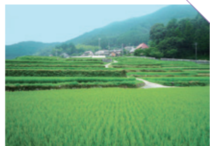
にし たに 西の谷の棚田 [佐賀市富士町] CHECK/絶好のツーリングポイント