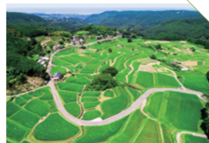
なかお 中尾の棚田 [藤津郡太良町] CHECK/秋 かかしコンテスト開催