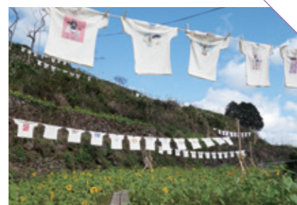
たけ 岳の棚田 [西松浦郡有田町] CHECK/9月 Tシャツアート展開催