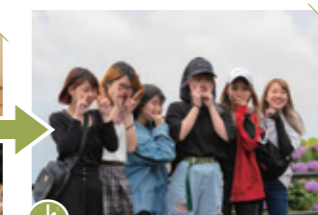
13:00 棚田をバックに記念撮影しよう! いい思い出になるね。

それぞれが思い思いのデザインが描けたみたいで、個性は十分に発揮できたと思います。手作りのカレーもとても美味しかったです。Tシャツ棚田展が開催される時には、またお手伝いにお邪魔します。展示されたTシャツを見るのも楽しみです。