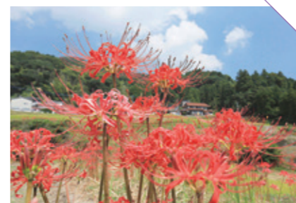
えりやま 江里山の棚田 [小城市小城町] CHECK/9月のひがん花祭り