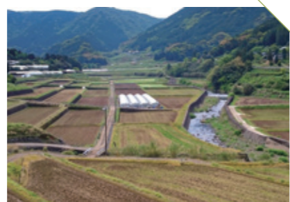
かわちの 川内野の棚田 [伊万里市東山代町] CHECK/8月 イノピカプロジェクト開催