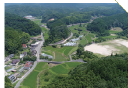
しもせきや 下関屋の棚田 [佐賀市富士町] CHECK/数量限定の落花生&そば