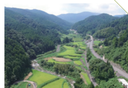
ちやのき 苜木の棚田 [佐賀市富士町] CHECK/6月下旬のホタルシーズン