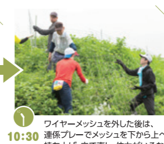
ワイヤーメッシュを外した後は、連携プレーでメッシュを下から上へ持ち上げ、立て直し。体力がいるな〜