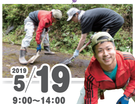
棚田内の水路の整備、休耕地の保全活動ボランティア日記 佐賀大学手間講隊 学生5名