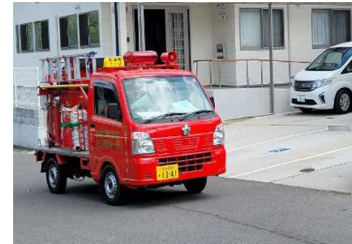
消防団による広報訓練