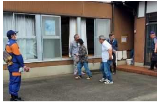
住民避難訓練(自主防災組織)