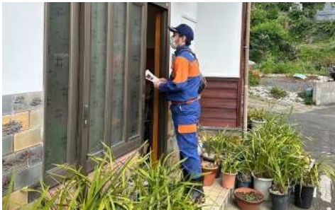
消防団による「こえかけ」広報訓練