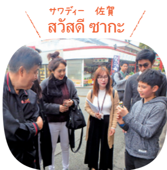
祐徳稲荷神社での通訳ボランティア

佐賀県在住のタイ人やタイ好きの人たちでつくる「サワディー佐賀」が、総務省の「ふるさとづくり大賞」で団体表彰されました。2018年に佐賀で開催された「タイフェア」をきっかけに設立。タイ料理教室やタイ語通訳のボランティアをはじめ、災害時にはタイ語による情報発信を行うなど、国際交流の参考になる取り組みが評価されました。ほかにも、特別定額給付金の申請書類にタイ語とやさしい日本語で説明を付けるなど、県在住のタイ人にとって心強い存在となっています。佐賀とタイをつなぐ交流の架け橋としてこれからの活動も期待しています！