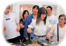
タイ料理教室を開催