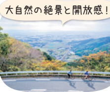
大自然の絶景と開放感!