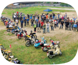
カブの愛好者たちが 大集合!

文部科学省が全国の公民館の中から表彰する優良公民館に、唐津市北波多公民館が選ばれました。同館は学校と連携し、図書室や空いた部屋を勉強部屋や遊び場として提供。子どもの来館が増え、大人の利用者と世代間交流が進んだことや、公民館から小学校に通う3泊4日の通学合宿での、子どもたちの自主性に任せた取り組みが評価されました。また、二輪車「スーパーカブ」の愛好者たちが県内外から集う「公民館deカフェカブ」というユニークなイベントを開催し、北波多の情報発信にも貢献。地域に根差した公民館として活動を広げています。