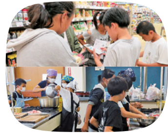
通学合宿で、買い物や調理に 挑戦する子どもたち