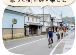
息づく街並みを楽しむ