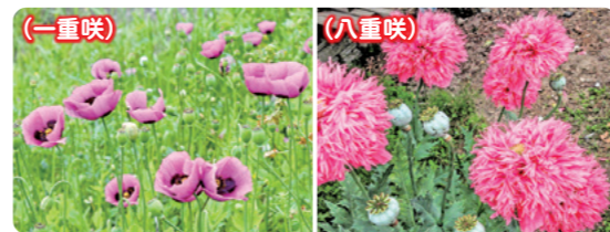
植えてはいけないけし

新緑の美しい季節になりましたが、畑や庭先などに「けし」が咲いていませんか? 「けし」の中には、法律によって植えることが禁止されている種類があります。植えてはいけない「けし」を発見した場合は、最寄りの警察署、各保健福祉事務所または薬務課までご連絡ください。