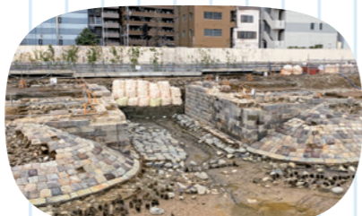
▲出土した高輪築堤 (東京都港区)

日本最初の鉄道は、大隈重信の英断で海の上を走った。「高輪築堤」の遺構が発見されました 1872年に日本初の鉄道が開業する際に造られた「高輪築堤」の遺構が、東京都港区のJR高輪ゲートウェイ駅周辺で見られました。日本初の鉄道建設の際、用地取得に難航した高輪付近は、大隈の英断により、海上に築堤し線路を敷設しました。3月22日、山口知事は萩生田文部科学大臣と面会した際、高輪築堤と大隈の関わりや遺構保存にかかる熱い想いを伝え、国と県は遺