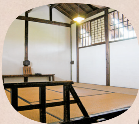
▲生家に当時のまま残る大隈の勉強部屋

字を書かなかった大隈重信 大隈重信の自筆として残っているのは、17歳の頃に寄せ書きした自作の漢詩と、明治20年の「東京府貫属仰付御請書」の2つとされています。総理大臣を務め、教育機関を立ち上げたほどの人物が書き残したものがたったそれだけなのは、どうしてなのでしょう。それは、大隈が生涯を通して字をほとんど書かなかったからです。