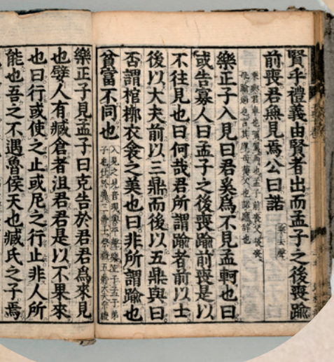
▲弘道館時代に使用していた教科書 (大隈重信記念館蔵)

字を書かなかった大隈重信 大隈重信の自筆として残っているのは、17歳の頃に寄せ書きした自作の漢詩と、明治20年の「東京府貫属仰付御請書」の2つとされています。総理大臣を務め、教育機関を立ち上げたほどの人物が書き残したものがたったそれだけなのは、どうしてなのでしょう。それは、大隈が生涯を通して字をほとんど書かなかったからです。