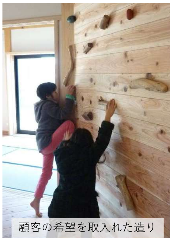
顧客の希望を取入れた造り