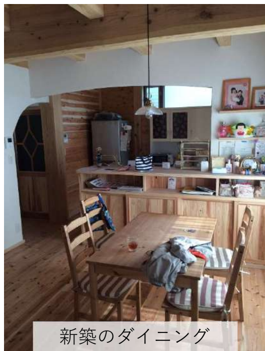
新築のダイニング