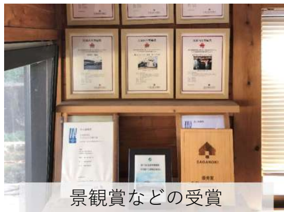
景観賞などの受賞