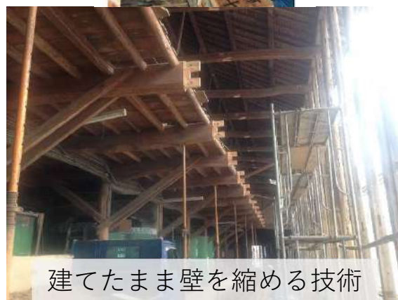
建てたまま壁を縮める技術