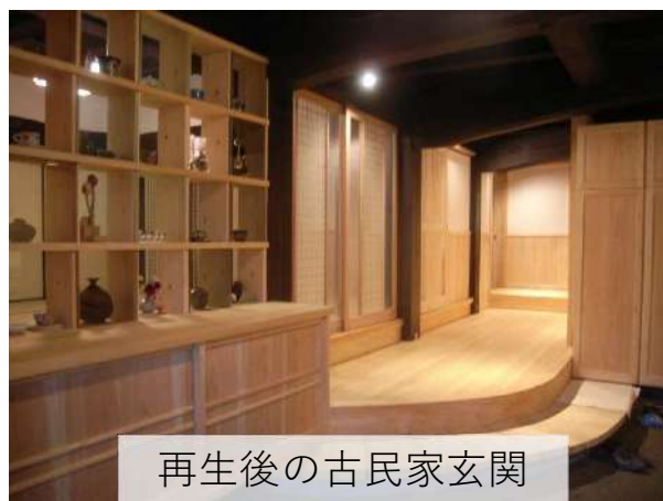
再生後の古民家玄関