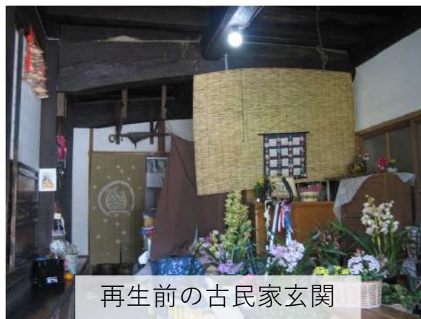
再生前の古民家玄関