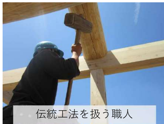
伝統工法を扱う職人