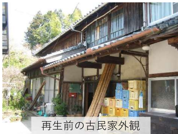
再生前の古民家外観