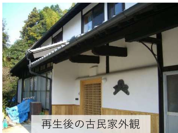
再生後の古民家外観