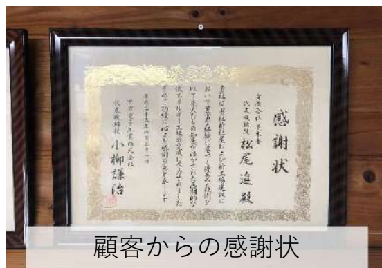
顧客からの感謝状