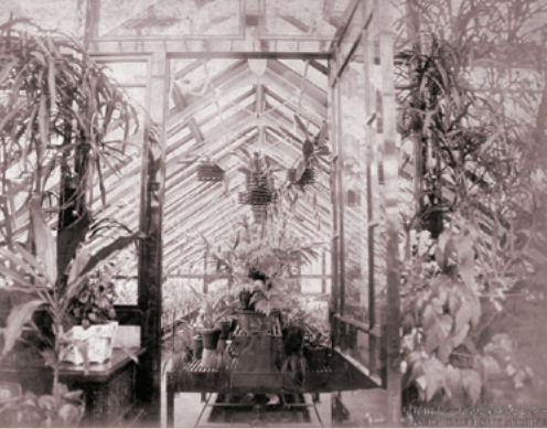
▲大隈の邸宅にあった温室

温室を観光して、植物を観賞して、楽しむ機会を設けた。盛大な観菊会を催すなど自慢の植物を鑑賞して、