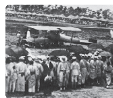
佐賀初飛行大会の様子

現在、アリーナ建設が進むこの地は、百年に渡って佐賀の新時代の象徴であり続けてきました。協楽園、博覧会、国体等、当時の公文書とともに、地域の移り変わりを紹介します。