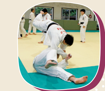
得意の投げ技を気持ちよく決めます!

いときはライバルの存在を思い出し、奮起して仲間と一緒に頑張ってきました。優勝を重ねて、将来はオリンピック選手になりたいです。」と笑顔を輝かせます。