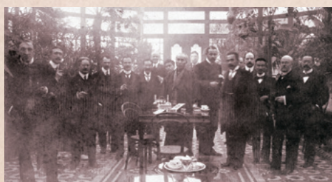
▲大隈邸温室に招かれた外国人ジャーナリスト大隈(中央)

ほか、温室や庭園で来客との語らいを楽しみました。メロンが好物で、「日本人で最初にマスクメロンを食べた人」と言われています。品種改良も行い、新品種「ワセダ」を開発。マ