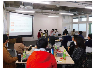
プログラミング合宿の成果発表会

ものづくりの現場では、熟練技能者の高齢化が進み、技能の伝承や後継者の確保が大きな課題となっています。 県では、AIを活用して技能を解析し、継承を進めていくものづくり企業に対して補助を行います。また、熟練技能者が、技能競技大会に出場する若手技能者や、技能検定を受検する高校生に対して指導をする際の補助も行います。さらに、佐賀が誇る伝統的地場産品のうち、特に後継者不足に直面している産品をモデルケース