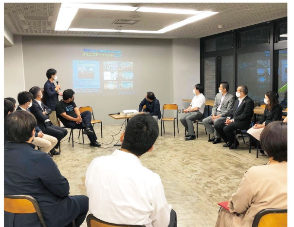
スタートアップのコミュニティイベント