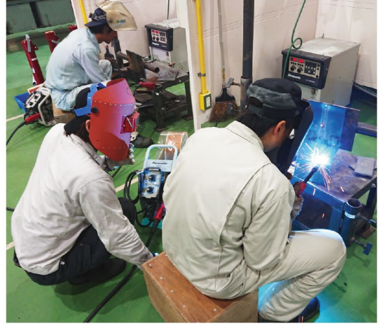
熟練技能者が指導を行う様子

これらの成果と蓄積を生かし、県では、佐賀から世界を目指していくような起業のための環境づくりを一層進め、産業スマート化センターの機能強化や人材不足が顕著なプログラミング人材の育成・確保に努めていきます。 ※DX/IT技術を浸透させることで、人々の生活を良い方向へ変化させるという概念。