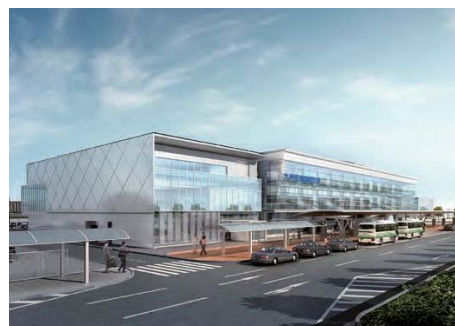
完成イメージ図