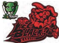
サガン鳥栖、久光スプリングス、佐賀バルーンズ、鹿津レオブラックスレオナイアース