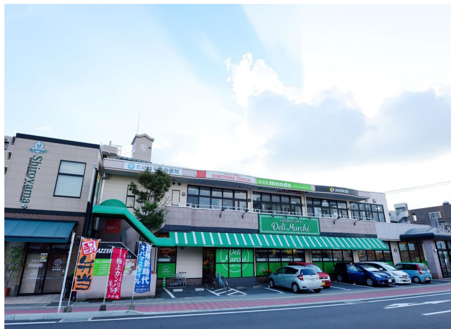
店舗外観（しろやまデリ・マルシェ）