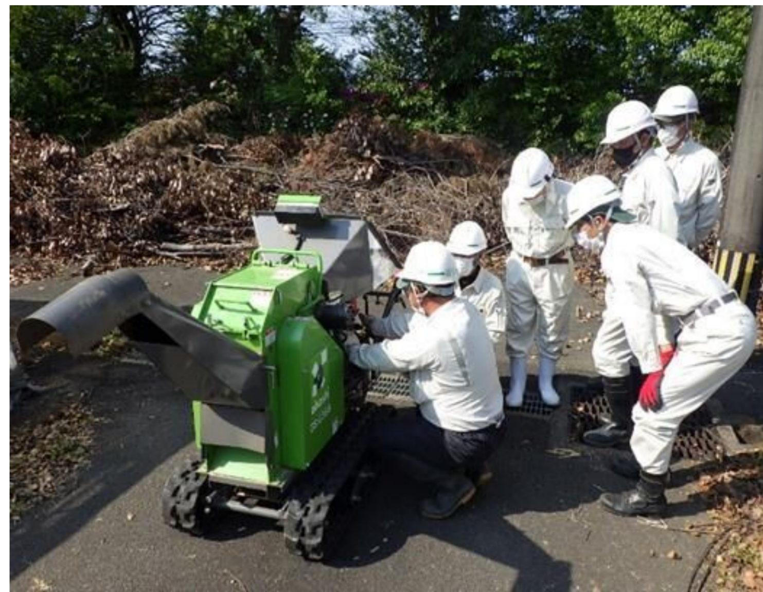
ベテラン職員から若手職員へ技能継承