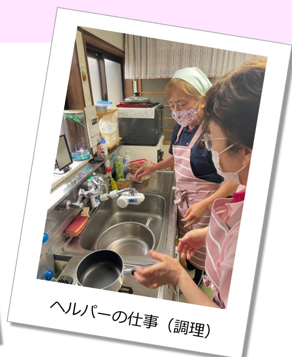
ヘルパーの仕事（調理）