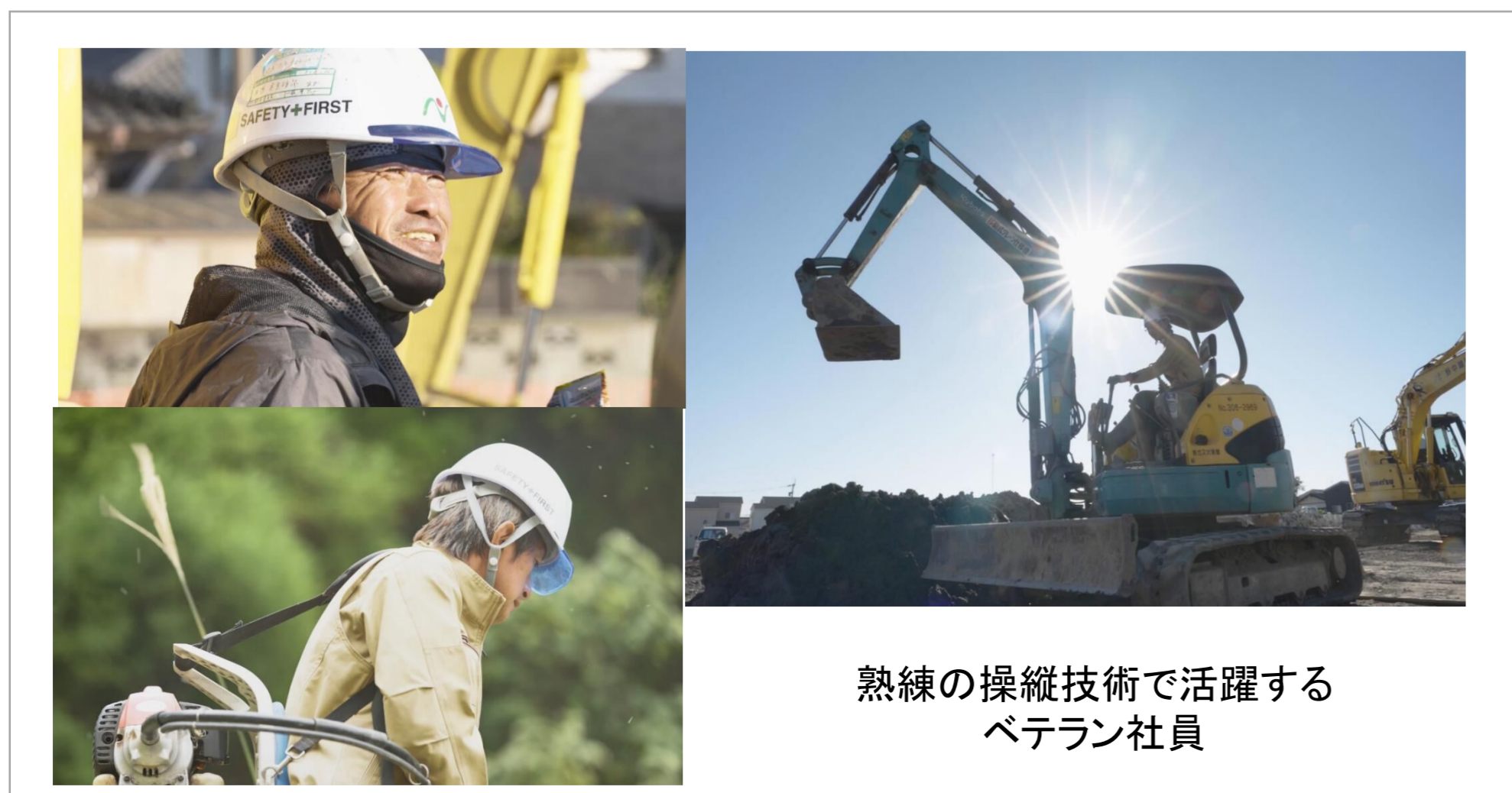
熟練の操縦技術で活躍するベテラン社員

一度病気のために野中建設を退職しましたが、回復後会社を訪ねたら「元気なら戻って来んね」と声をかけてもらいました。今では体調に合わせた勤務日数で、現場にも配慮してもらいながら勤めています。働いて体を動かすことが元気づくりでもあり、故郷への御恩返しだと思っています。これからも体と相談しながら働き続けたいと思います。