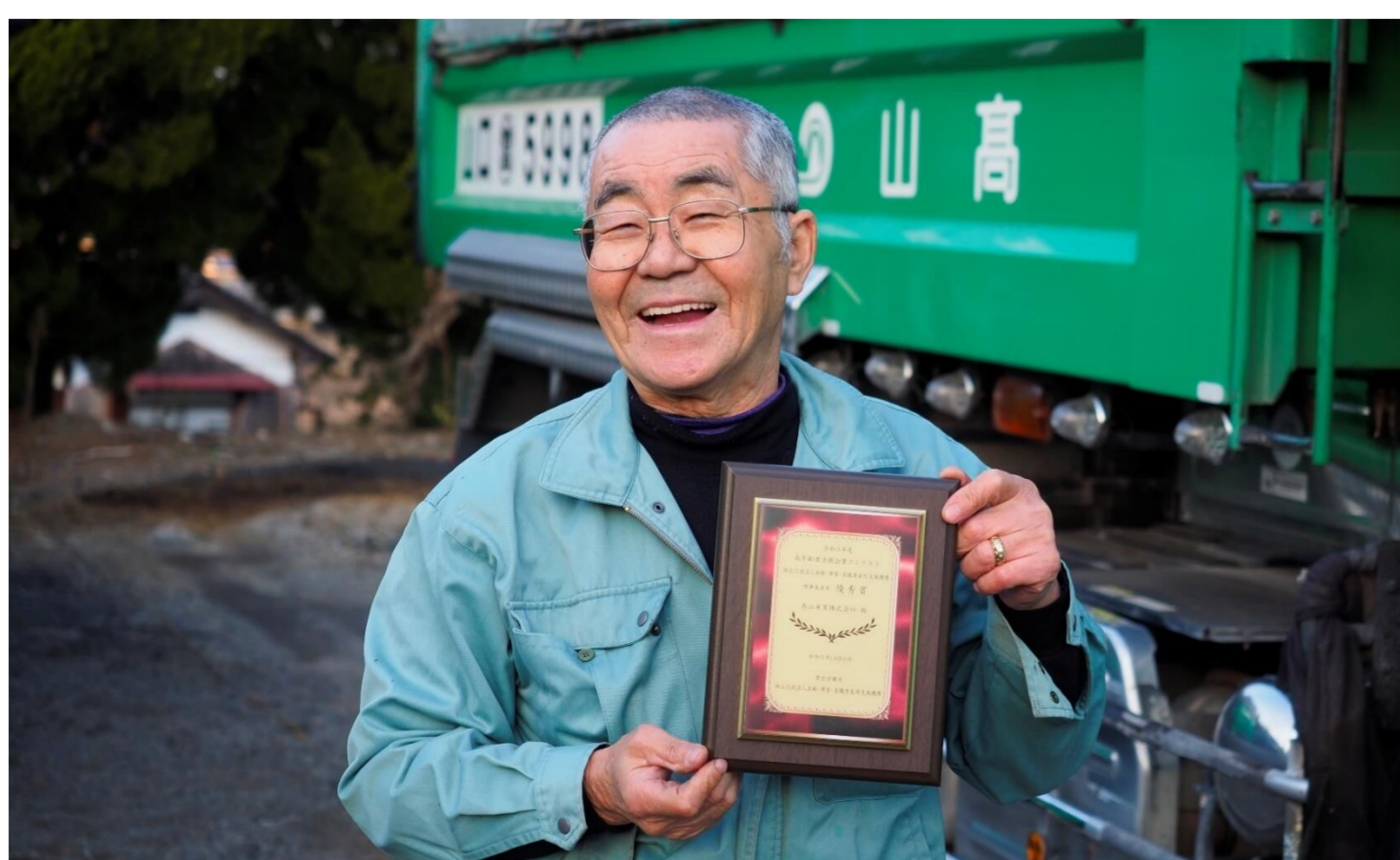
入社して50年、まだまだ現役！

私がここまで働き続けられたのは、会長の人柄と会社のおかげです。若いときは会社に迷惑をかけたこともありましたが、いろいろと助けてくれました。だから、会社のためにがんばろうと思いました。会社に感謝です！