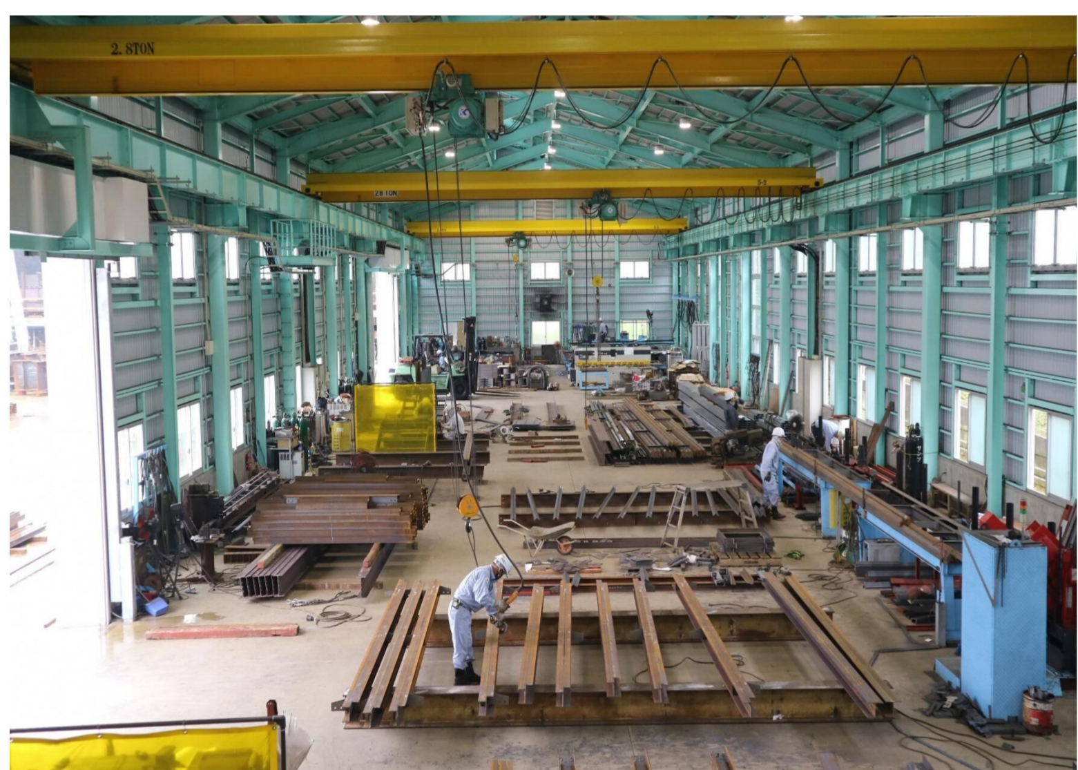
鋼構造物の制作を行っている自社工場