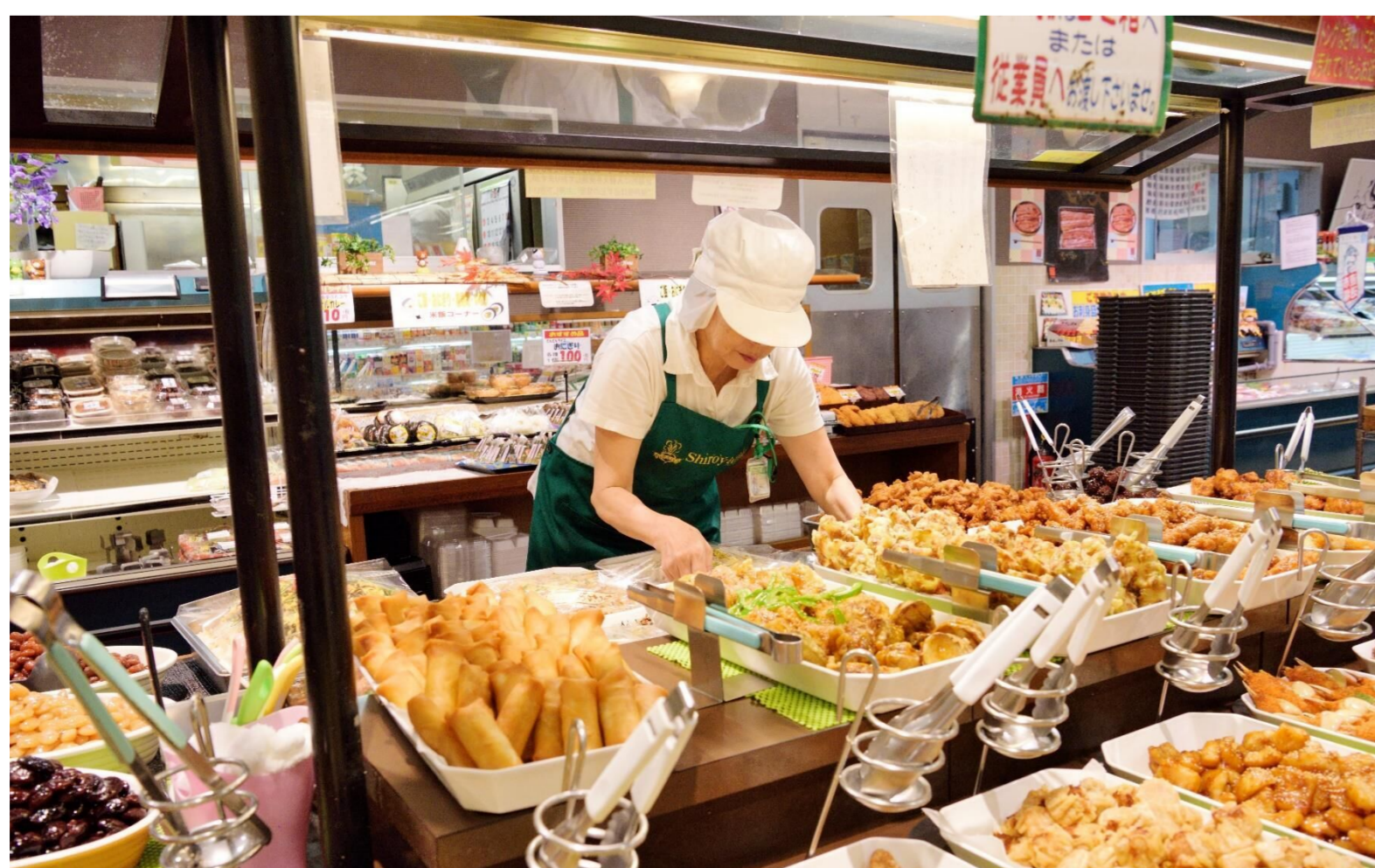
惣菜の品出しを行うベテラン従業員

長く、のびのびと楽しく勤務させていただいております。人は働くことに生きがいを感じ、働くことによって幸せを感じることができると思っています。体は年々衰えていきますが、気持ちが続き、会社が必要としてくれる間は進んでなんでもしたいと思っています。これからもお客様に喜んでもらえるように頑張ります！！