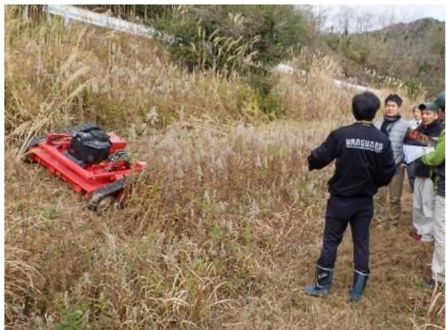
リモコン草刈機導入により身体的負担を軽減