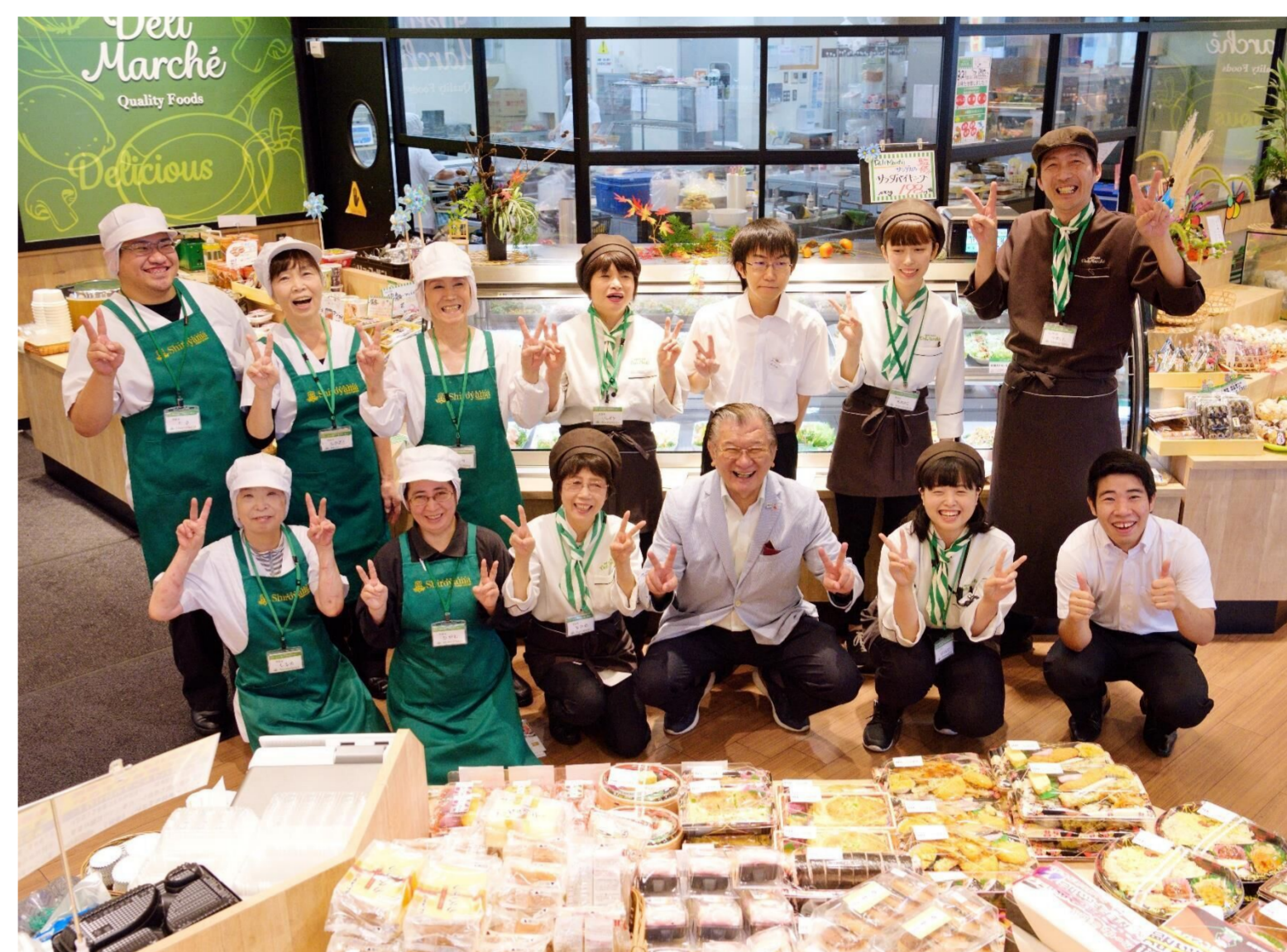
ベテラン従業員も活躍できる職場です

弊社は創業した1970年から地元鹿児島島の味、手作りの温かい味を追求してまいりました。手作りのぬくもりは素材の特徴についての知識や調理の洗練された技術から生まれます。お客様に喜んでいただける商品づくりを追求した結果、ベテラン従業員の豊富な知識や調理が貴重な武器として現在も引き継がれています。