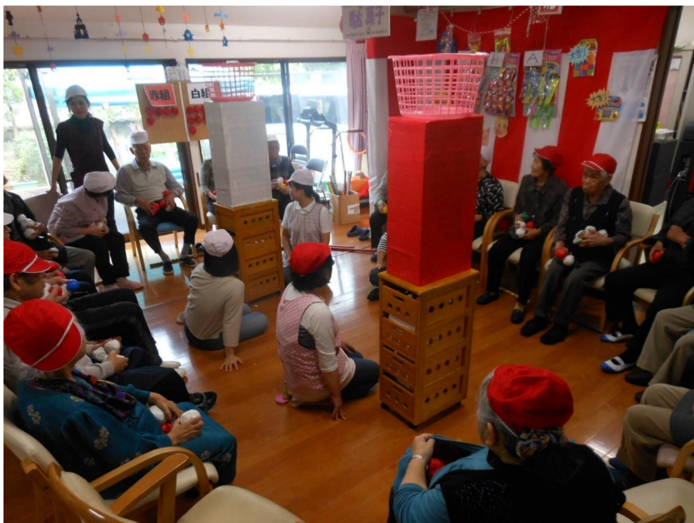
デイサービスの大運動会