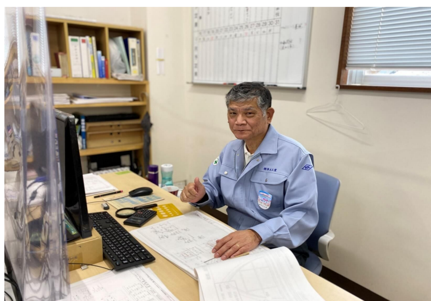
鉄骨工事の精算業務を担当しています

さまざまな業務に携わってきたので、これまでの経験が活かされるところにやりがいを感じます。鉄骨工事もそうですが、橋梁工事にも長く携わってきたので、そのノウハウもどんどん教えていこうと思っています。