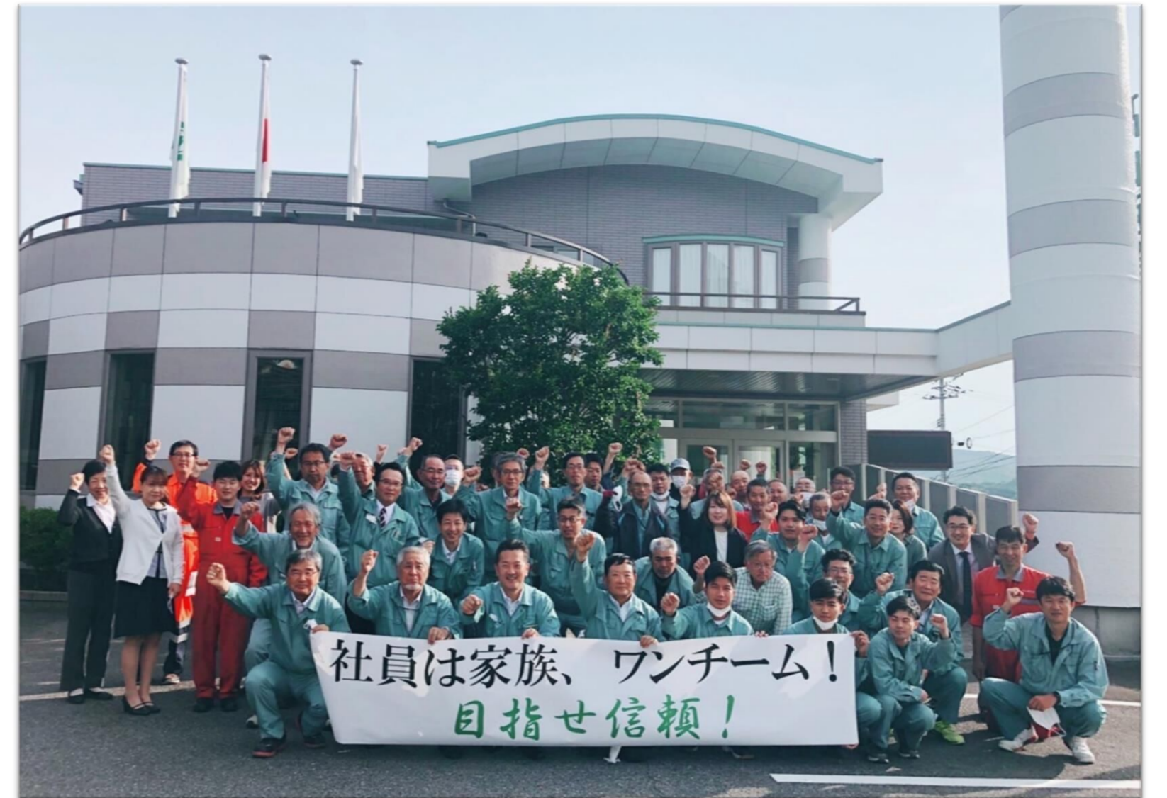
新事業年度 会社スローガン発表

1954年に創業し68年を経た当社は、次の100年を目指す上で、経験豊富な人材の確保と、企業の財産である高齢者により培われてきた技術力や知識を若手社員へ伝承するため、定年の引上げ等を行うこととしました。