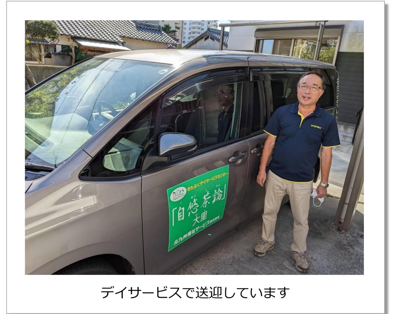
デイサービスで送迎しています

そのような中、弊社では高齢であっても元気に介護を続けている方が多くいます。これまで培った経験やスキルを活かしながら、個々人の希望に合わせて長く働き続けることのできる環境・制度づくりを目指しています。