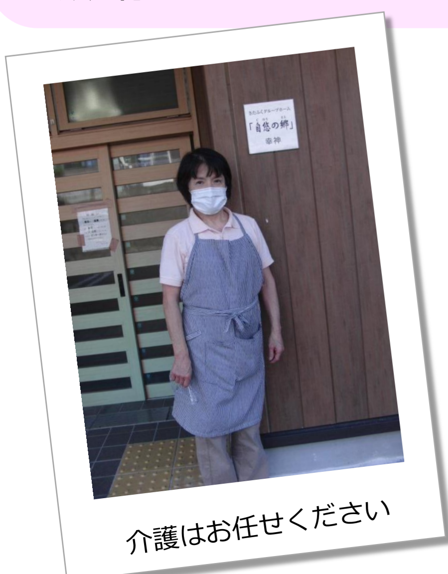
介護はお任せください