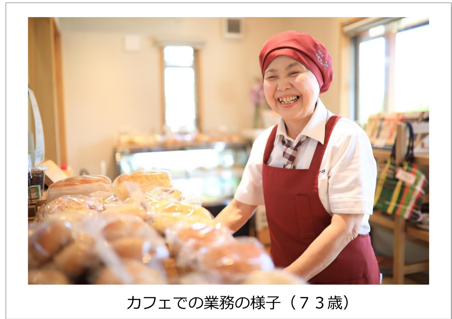
カフェでの業務の様子（73歳）

20代～70代までの人材が集い、年齢・性別を問わず、お互いに協力し合う風土。個々人のライフステージに合わせた働き方が出来る柔軟な職場です。