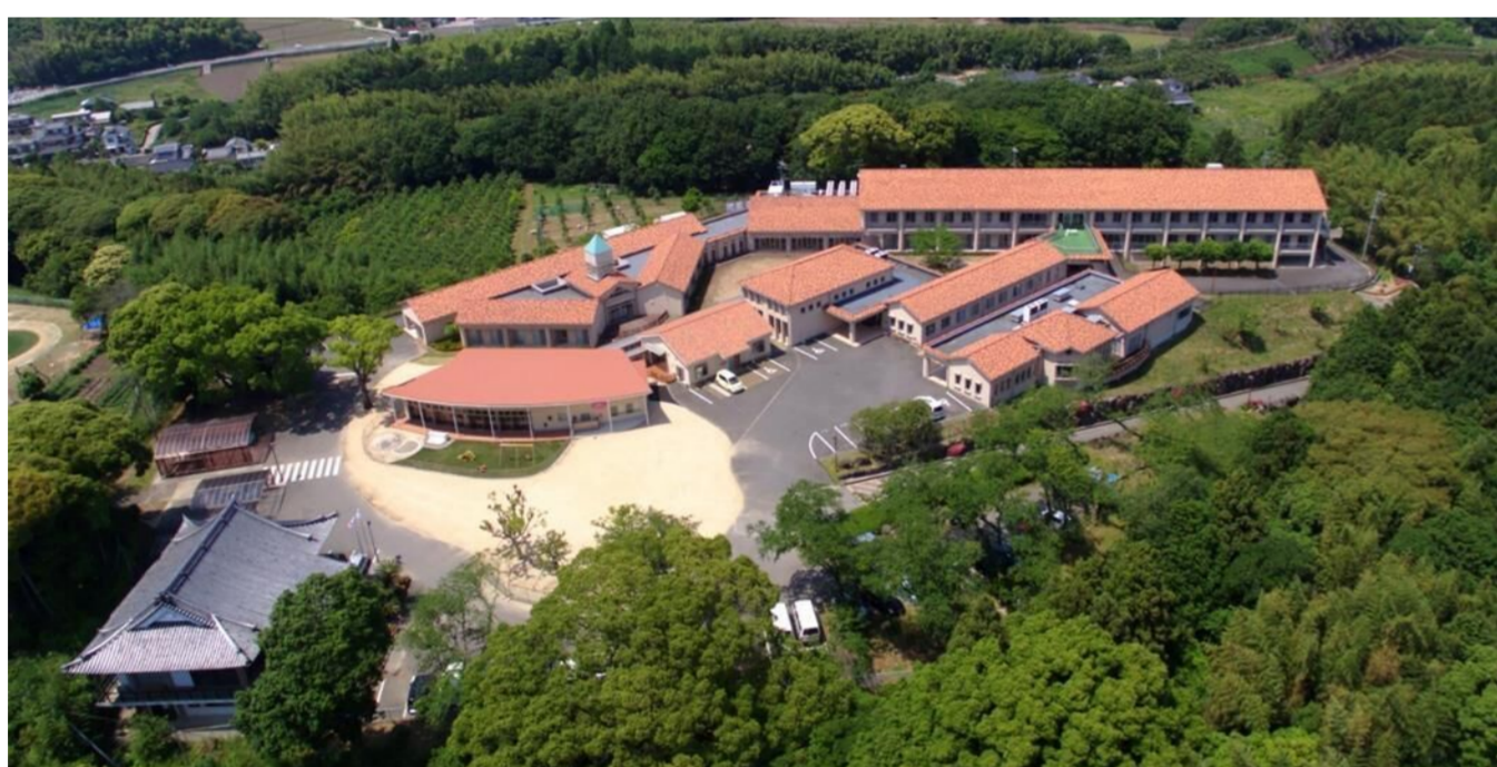
日出町内 運営施設