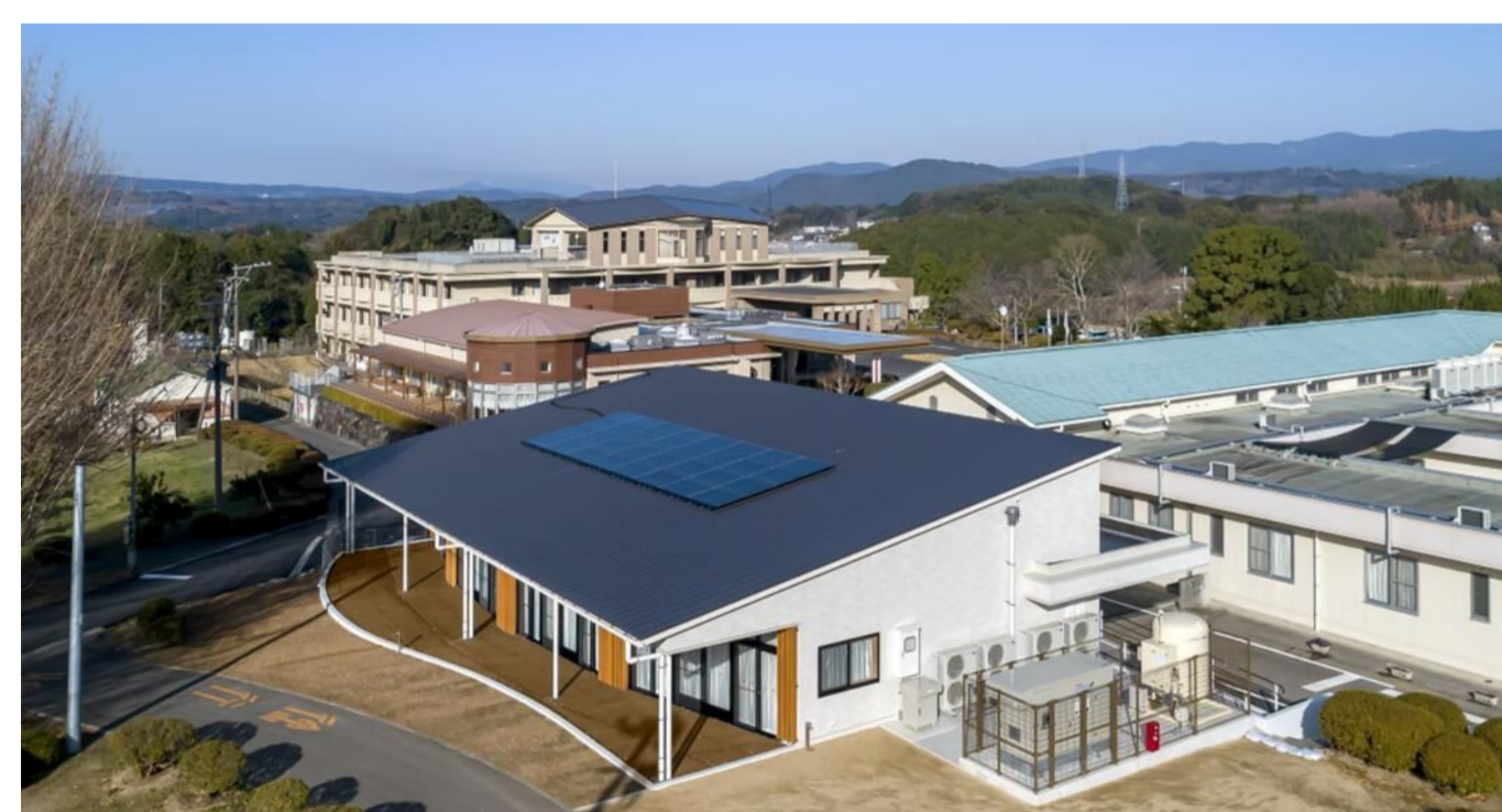
杵築市内 運営施設