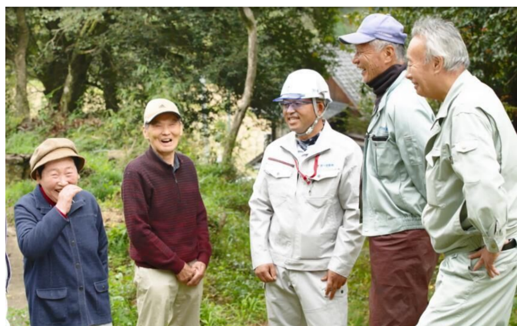
施主さんの喜ぶ顔が私たちのモチベーションです