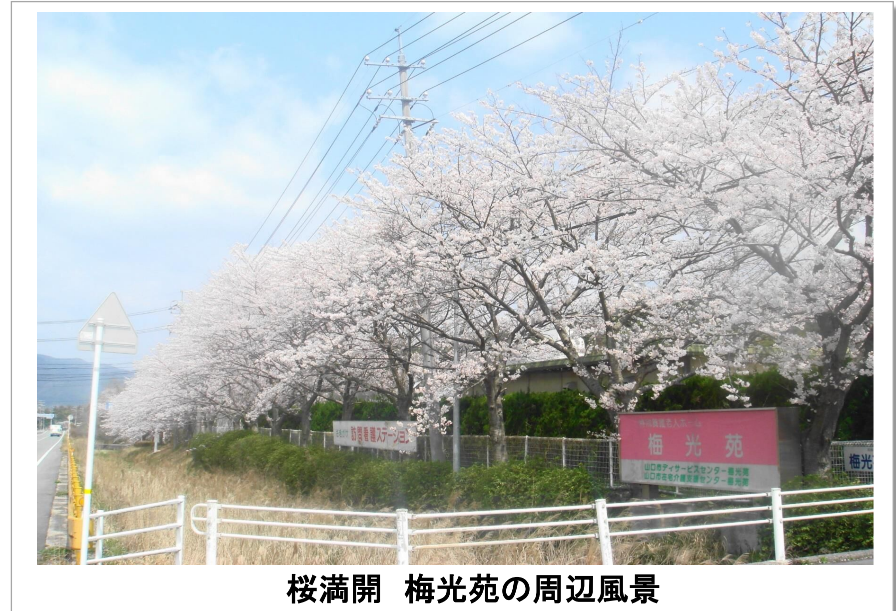
桜満開 梅光苑の周辺風景

少子・高齢化の進展により、介護業界においても人材不足が深刻な問題となっています。そんな中、知識・経験・スキルが豊富な高齢者は貴重な戦力であり、経験の少ない職員への生きた「お手本」でもあります。また、若者や新規採用者の確保が難しくなっていることから、高齢者の方々には、健康で生き生きと働いていただきたいと考えています。