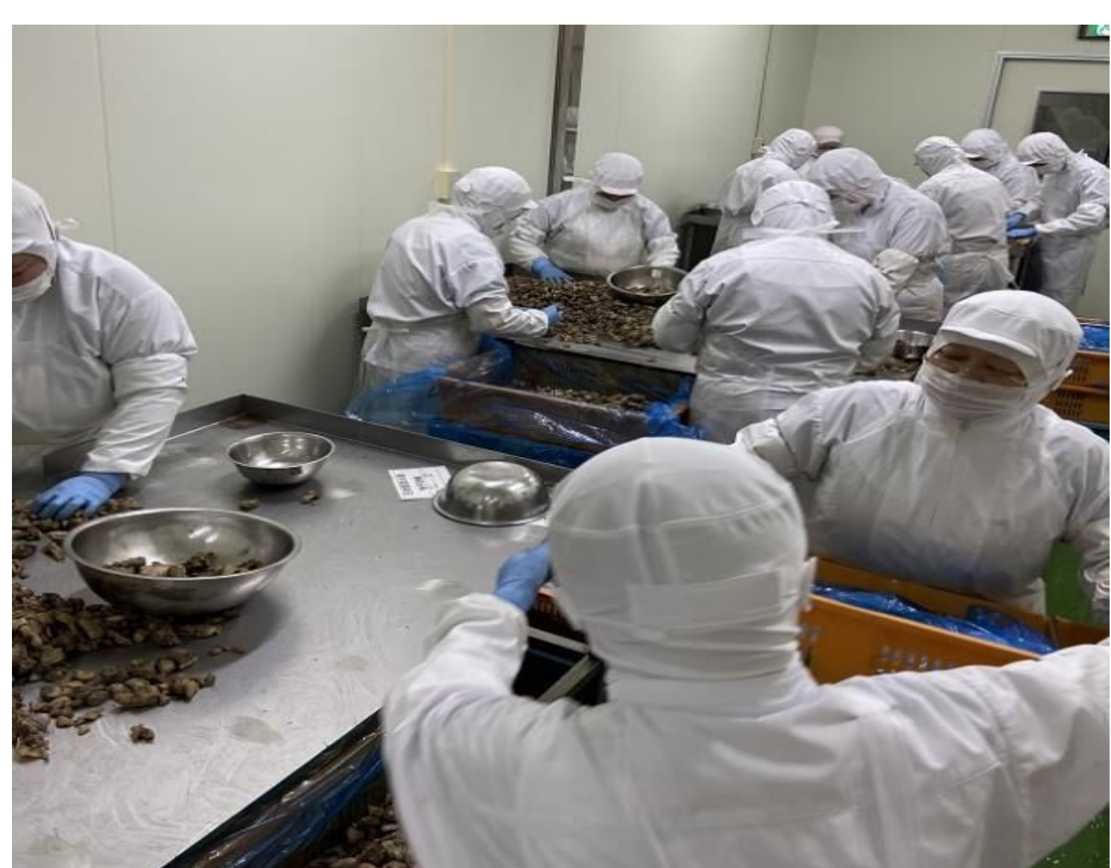
高さ調節可能な作業台