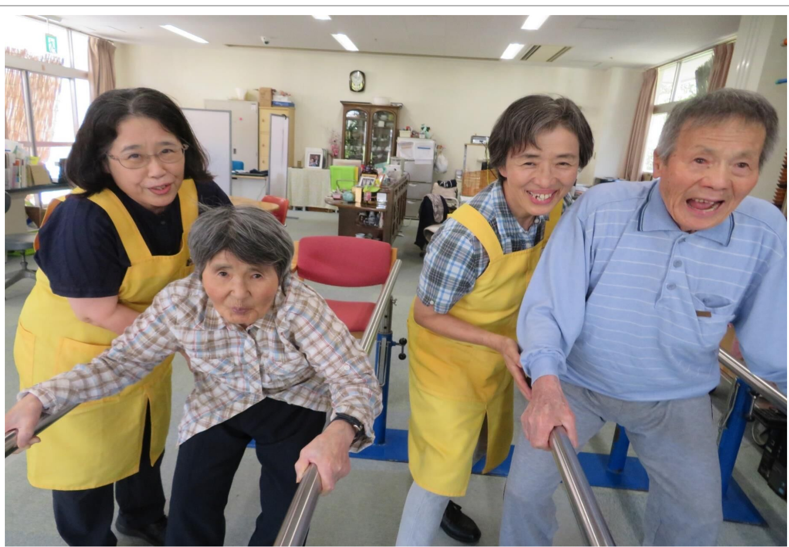
歩行訓練、がんばってます!!