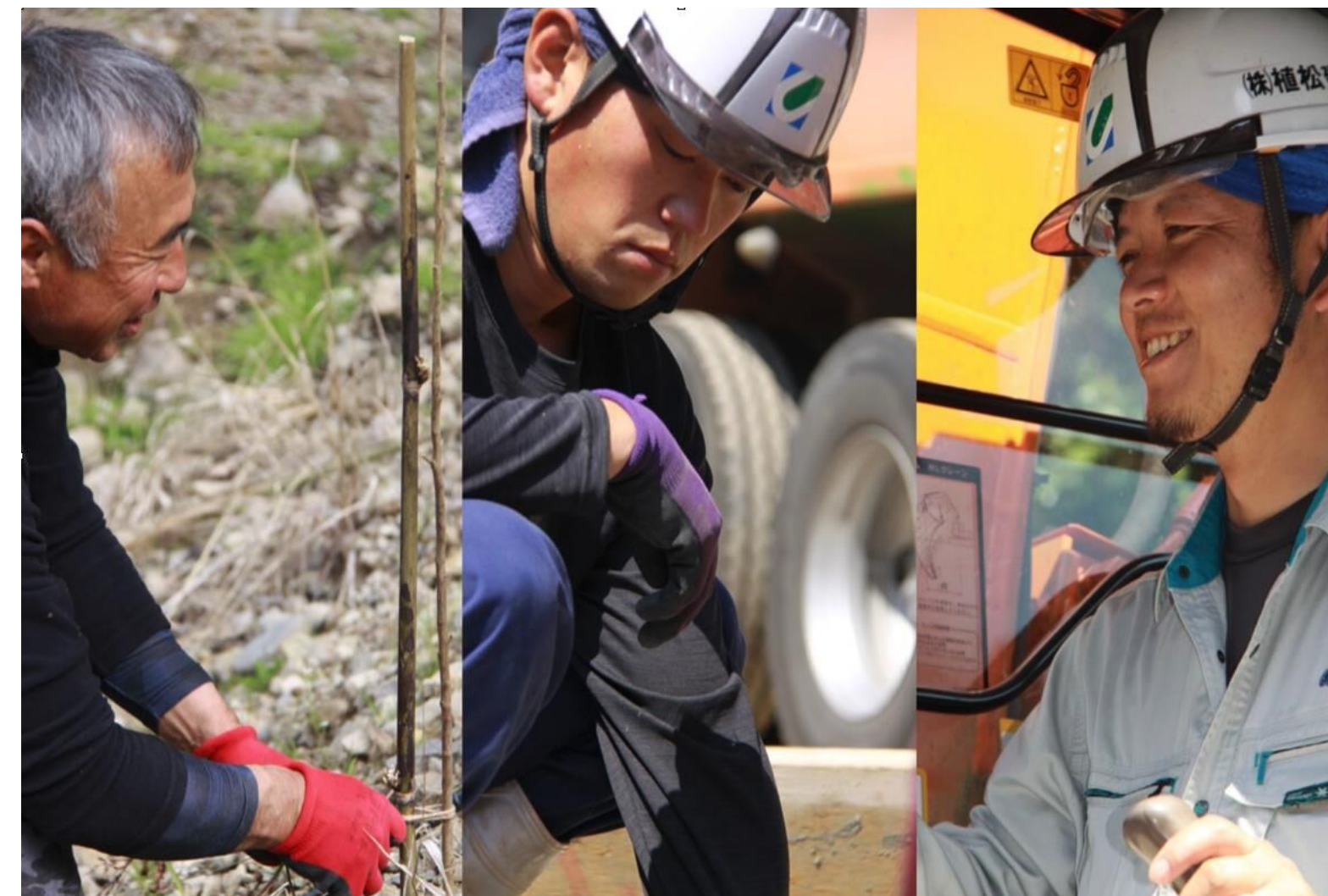
現場で活躍する社員

当社では、令和4年度より定年制を撤廃し、社員37人のうち11人が60歳以上のベテランとして活躍しています。「地域に愛される会社でありたい」、「関わる全ての人々が互いにより良くなっていくような会社でありたい」という願いを持っています。その願いを実現するためにも、共に働くスタッフを大事にすることが重要なことと捉えています。