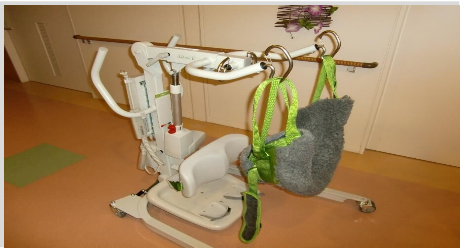
様々なタイプの機器を導入し、職員の負担を減らしています。