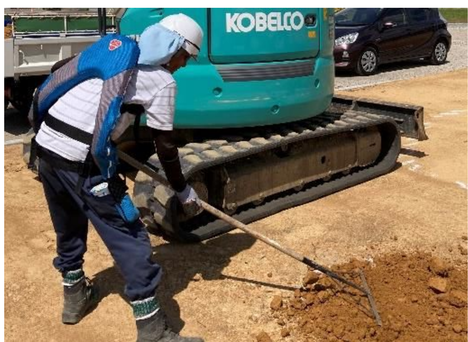
アシストスーツを着用しての業務風景