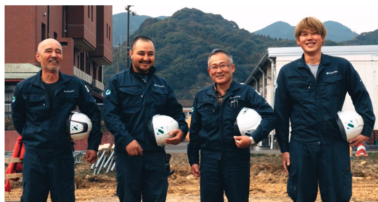
みんなが働きやすい職場環境づくりを目指しています