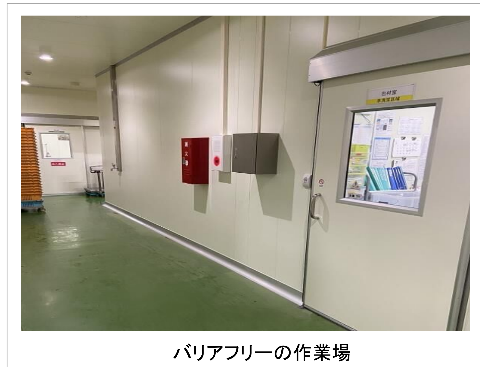
バリアフリーの作業場

若年層が町から流出し、65歳以上の高齢者人口が1/4を超える中、高齢者は貴重な労働力であることや、食品製造メーカーである当社は、家庭で長年料理をしてきた高齢女性の料理の腕や段取りの良さが生かせる職場であることから、地元企業を定年退職した高齢女性に声をかけ、従業員4人で始めたのが会社の始まりです。