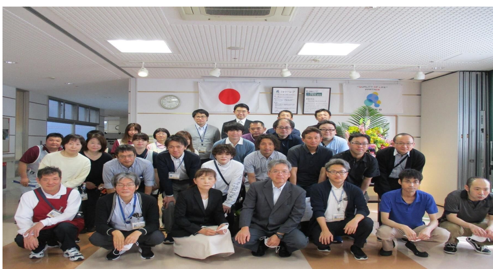
年齢・性別を問わず誰もが楽しく働ける職場です。

現在のクオラの出発点である松下医院のころに住み込みで働き出し、勤続43年となります。結婚、出産など様々なことがありましたが、その都度働きやすい環境を用意していただきました。他に誘われたこともありますが、お世話になっているため、自分はクオラで…と続けてきました。これからまだまだ働いてきたいので、健康第一。それとやはり、サービス業だから笑顔を大事にしたいと思います。(75歳、勤続43年)