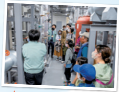
バックヤードツアー