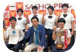
佐賀商業高等学校の皆さんに表彰状と優勝カップを授与しました