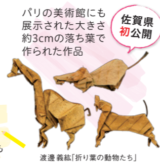
渡邊義経「折り葉の動物たち」