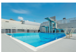
飛込プール (国内基準飛込プール)