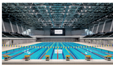
大型ビジョンや1,200席の観客席を備えたメインプール(50m国際基準競泳プール)