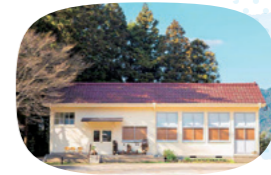
廃校となった校舎を人が集う拠点「分校Cafe haruhi」として再生 ※カフェは現在閉店しています

嬉野市の山間にある春日地区で地域づくり活動を行っている「春日活性化委員会」が、国土交通省の地域づくり表彰で大臣賞を受賞しました。廃校になっていた、140年以上の歴史を持つ木造校舎をカフェとして再生し、そこを拠点に地域住民と一緒に地区全体を盛り上げていく活動が評価されました。また、地区外から人を呼び込むきっかけにしようとするマルシェなどのイベントも企画。さらに、地元高齢者の知恵を活かして、耕作放棄されていた茶園で茶の実を収穫・搾油し、化粧品の商品開発を行うなど、新しい産業を生み出しました。隠れていた地域の宝に光を当て、新たな魅力として育てていくプロジェクトに、今後も期待しています!