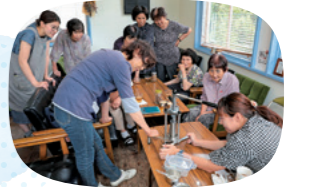
地元高齢者による「むかし美人の会」は、さまざまな活動を行っています!