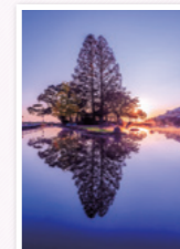
ぬいのいけ 縫ノ池(白石町)