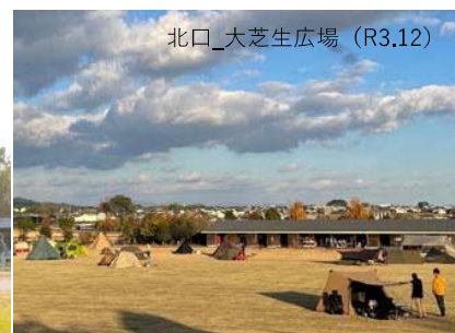
吉野ヶ里歴史公園キャンプイベント実施状況