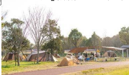
北口_野外炊事コーナー（R3.3）